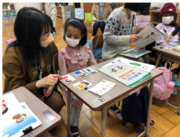
（左：三重県南伊勢町に未就学児向け英語教育のオリジナルカリキュラムおよび指導ノウハウを提供）