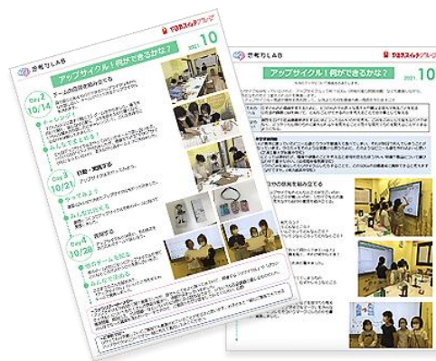
（左：バイリンガル幼児園「Kids Duo International」の職業体験プログラムラーニングステーションのイメージ）