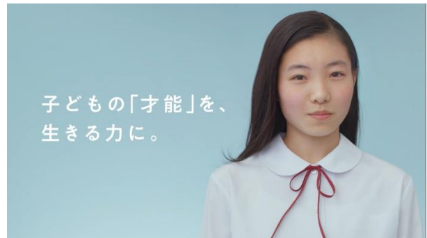
【企業CM】「才能を、生きる力に。」 — 変化が激しい時代に必要なのは、普遍的な「生きる力」と訴える