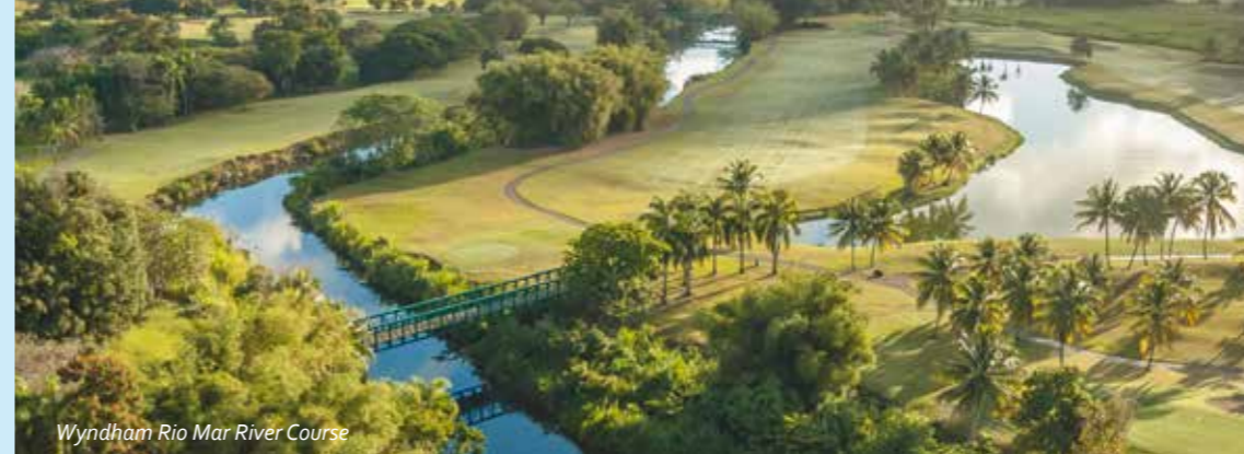
Wyndham Rio Mar River Course