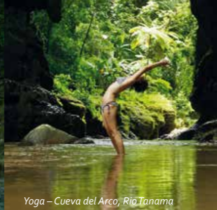
Yoga – Cueva del Arco, Río Tanama