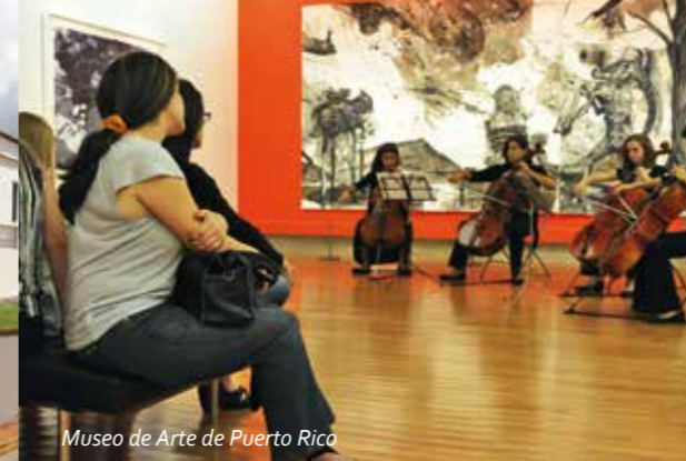
Museo de Arte de Puerto Rico