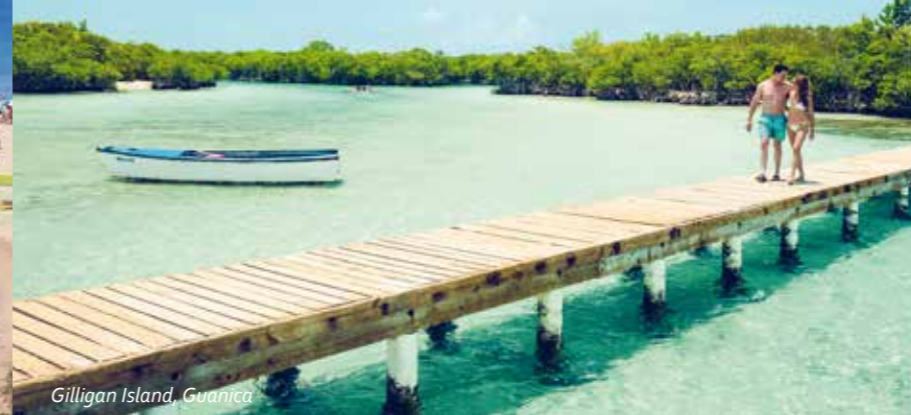
Gilligan Island, Guanica