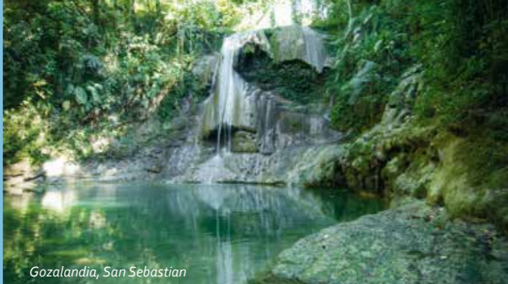
Gozalandia, San Sebastian