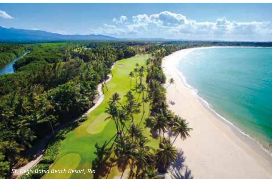
St. Regis Bahia Beach Resort, Rio