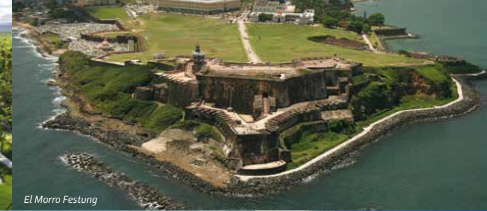
El Morro Festung