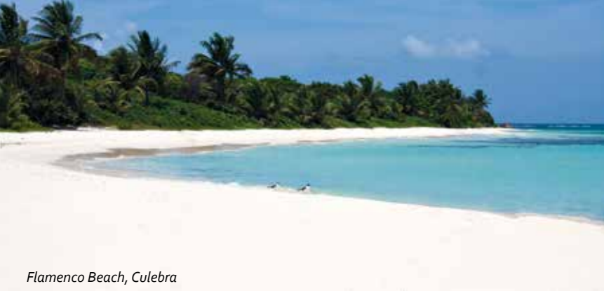
Flamenco Beach, Culebra