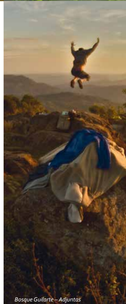
Bosque Guilarte – Adjuntas

Guanica Forest, weit im Westen gelegen, umfasst Strände, Mini-Inseln und einen der größten Vorkommen von trockenem Küstenwald, den es noch in der Welt gibt. Es ist ein hervorragender Platz zur Vogelbeobachtung im Morgengrauen. Diesem Hobby kann man auch sehr gut im Cabo Rojo Wildlife Refuge im Südwesten der Insel nachgehen.