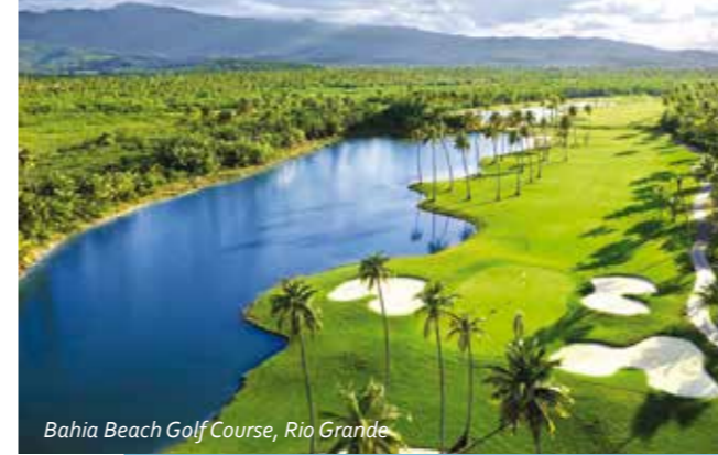
Bahia Beach Golf Course, Rio Grande