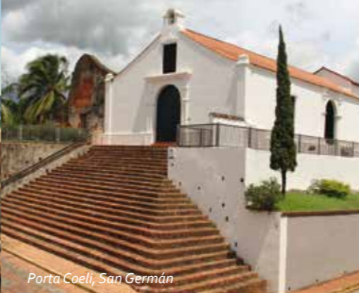
Porta Coeli, San Germán