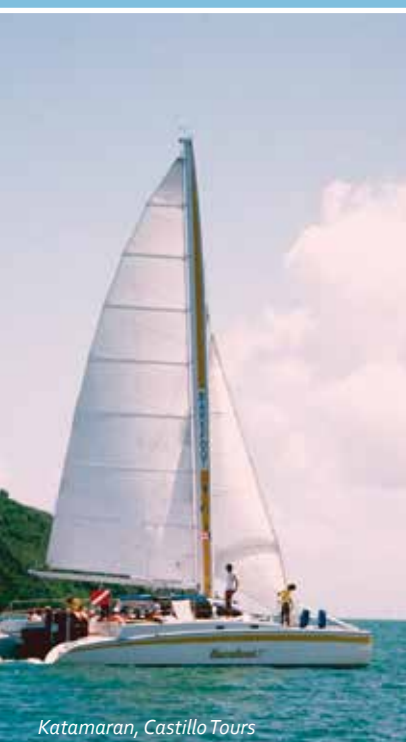
Katamaran, Castillo Tours

Vieques Air Link fliegt von den Flughäfen San Juan, Island Grande & Ceiba 787-722-3736