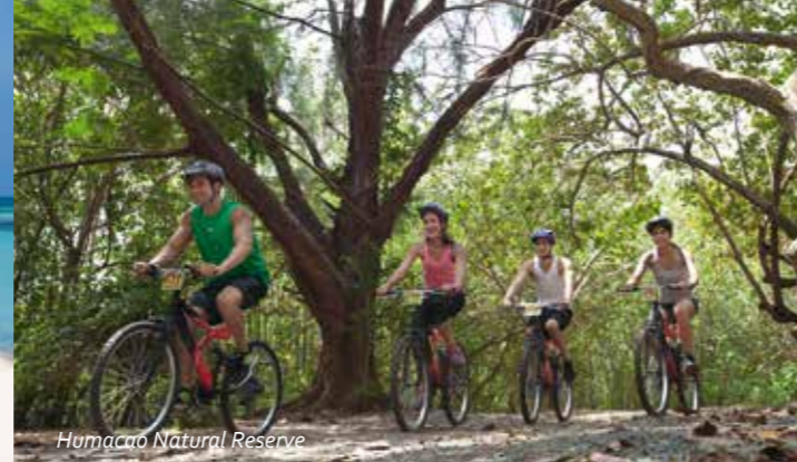
Humacao Natural Reserve