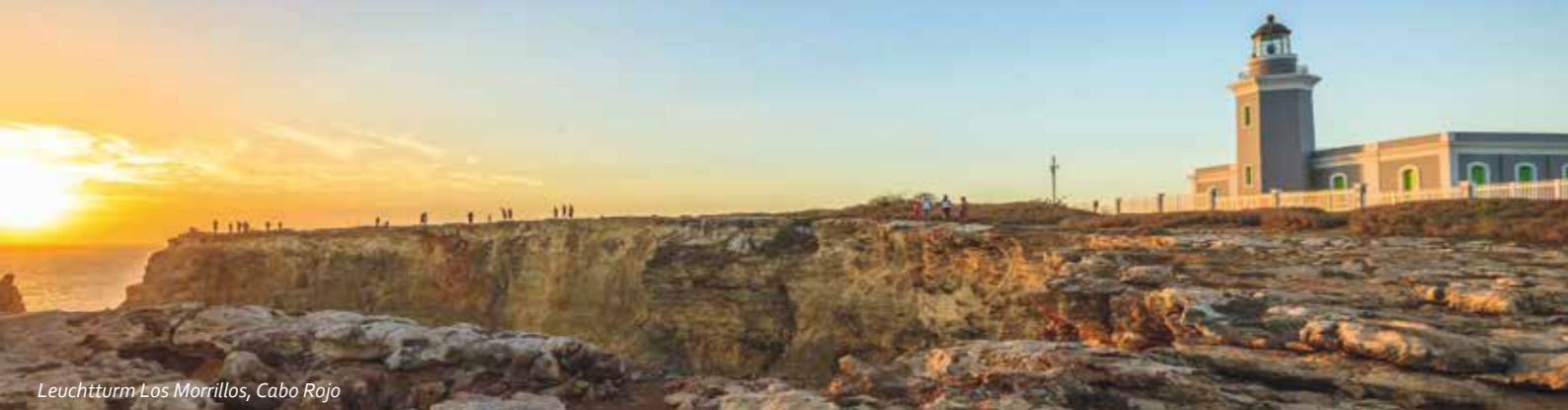
Leuchtturm Los Morrillos, Cabo Rojo