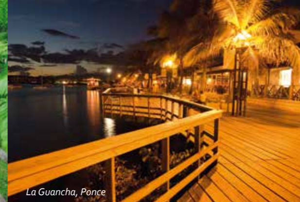
La Guancha, Ponce