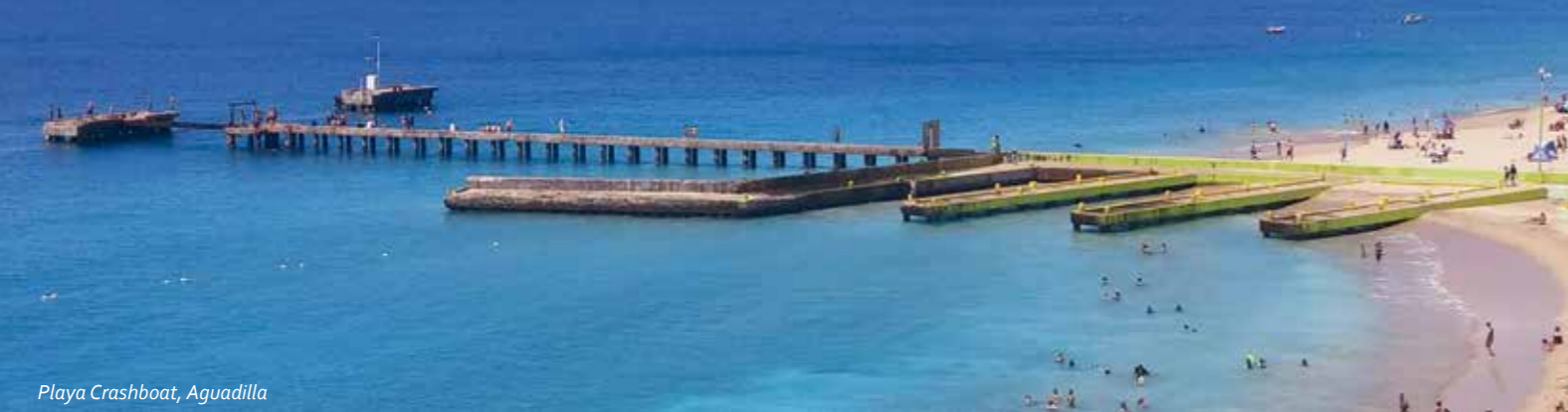
Playa Crashboat, Aguadilla