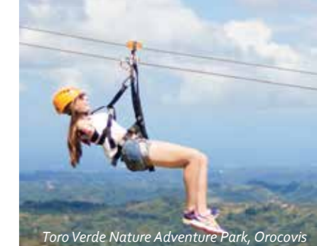
Toro Verde Nature Adventure Park, Orocovis