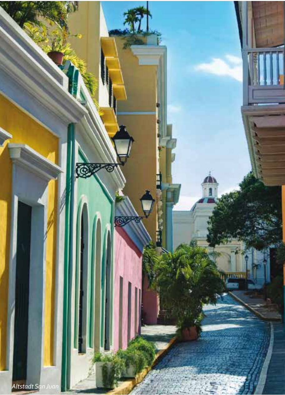
Altstadt San Juan