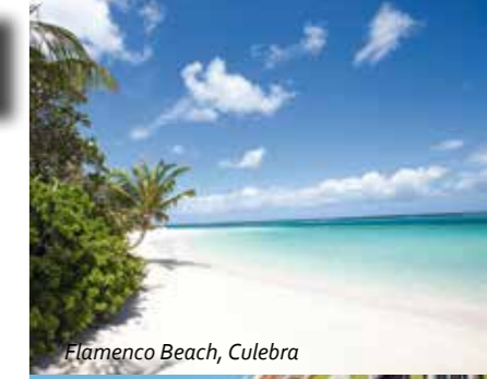
Flamenco Beach, Culebra

Im Nordwesten liegt Camuy mit dem berühmten Camuy-Höhlenpark. Inselstädtchen wie Vega Alta und Toa Alta sind gleichermaßen landwirtschaftliche und produzierende Zentren wie Siedlungsgebiet. Hier lohnen die Barceloneta Outlets sowie das Observatorium und der Leuchtturm von Arecibo einen Besuch.