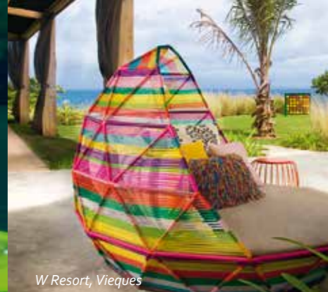
W Resort, Vieques