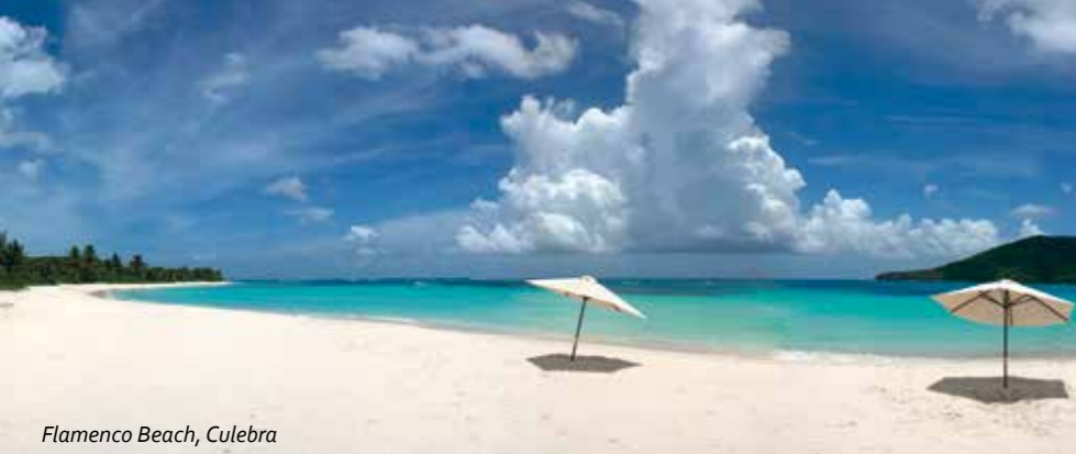
Flamenco Beach, Culebra