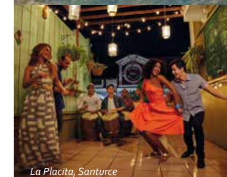
La Placita, Santurce