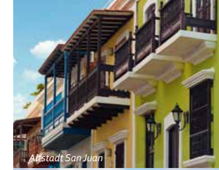
Altstadt San Juan