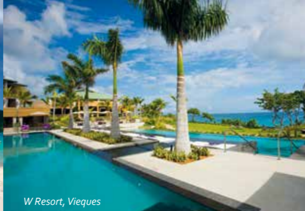
W Resort, Vieques