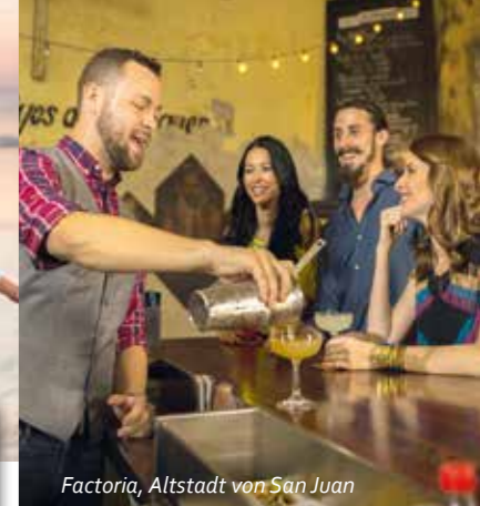
Factoria, Altstadt von San Juan