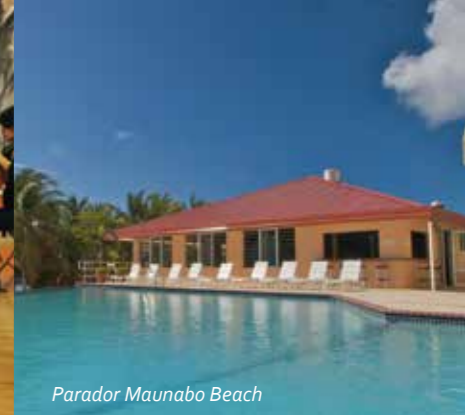
Parador Maunabo Beach

• Mayagüez Mayagüez ist die drittgrößte Stadt von Puerto Rico. Ihre elegante, gepflasterte Plaza zeigt sich mit einem Brunnen, Bänken und eine Statue von Christopher Kolumbus auf einem globusförmigen Sockel. Kinder werden sich im restaurierten Stadtzoo wohl fühlen. Mona Island, ein einzigartiges Inselnaturschutzgebiet, liegt circa 80 Kilometer westlich von Mayagüez und Cabo Rojo entfernt und ist bekannt als "Galápagos der Karibik". Besucher können über 60 Meter hohe Klippen, fast ein Meter lange Leguane und Piratenhöhlen besichtigen.