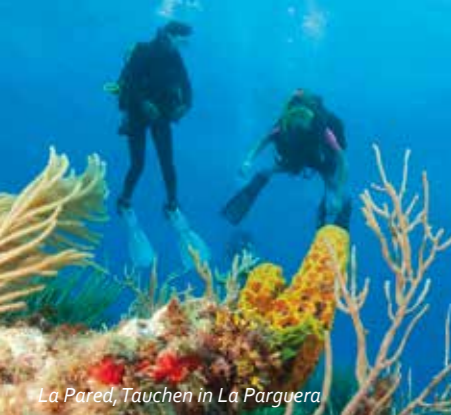
La Pared, Tauchen in La Parguera