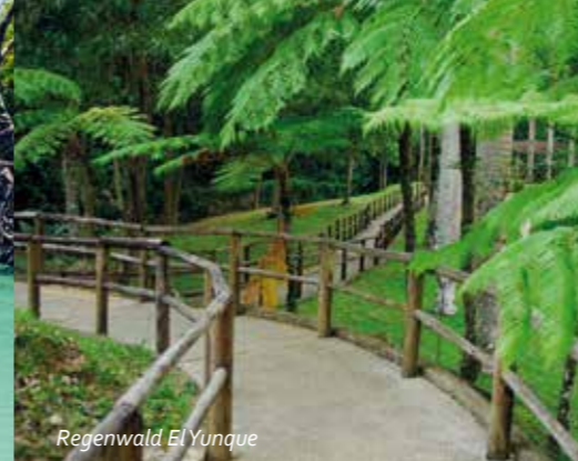
Regenwald El Yunque