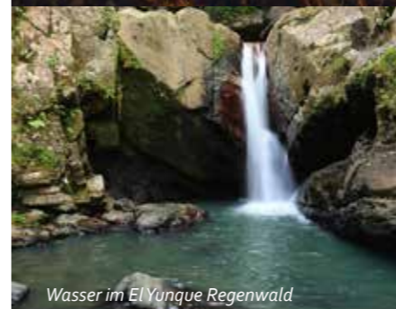
Wasser im El Yunque Regenwald