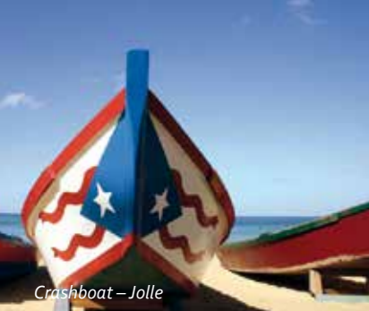
Crashboat – Jolle