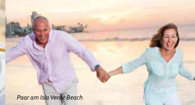
Paar am Isla Verde Beach