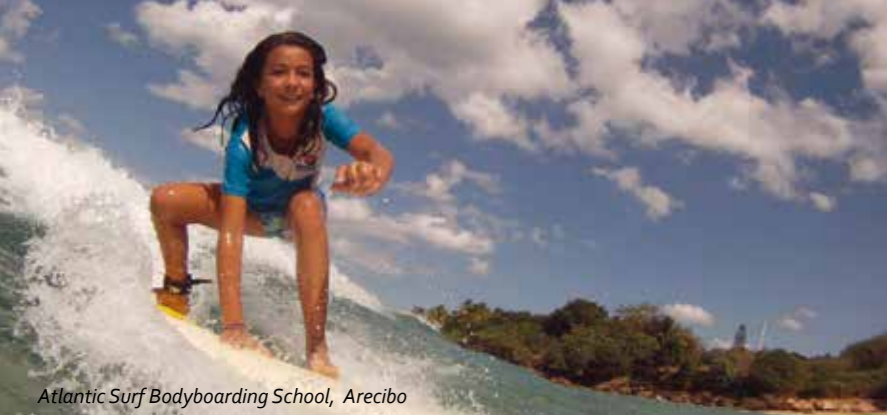
Atlantic Surf Bodyboarding School, Arecibo