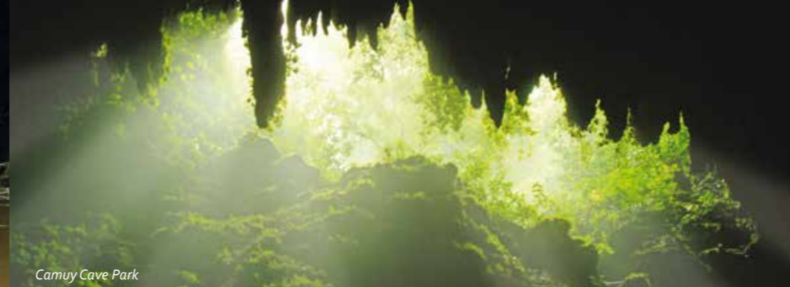
Camuy Cave Park