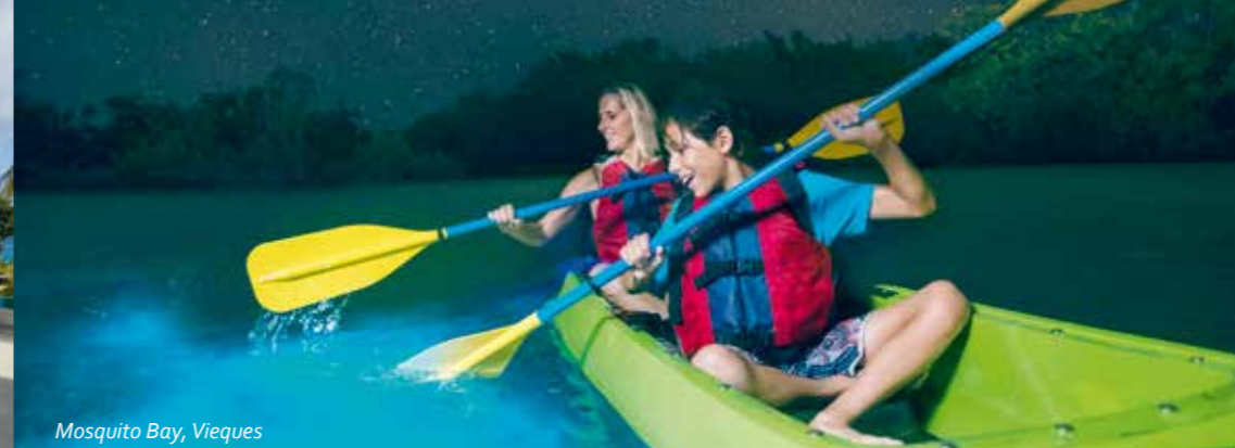
Mosquito Bay, Vieques