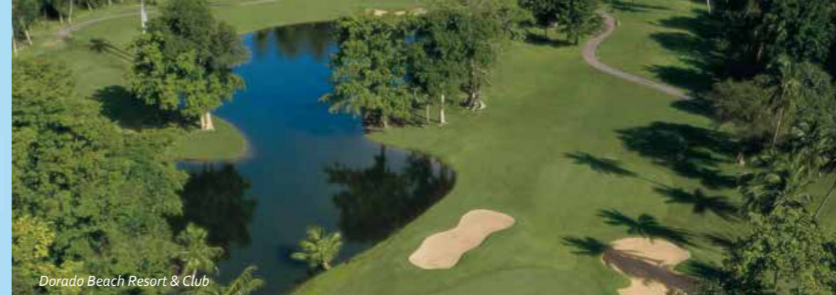
Dorado Beach Resort & Club