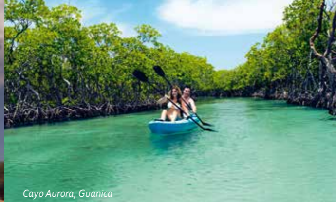
Cayo Aurora, Guanica