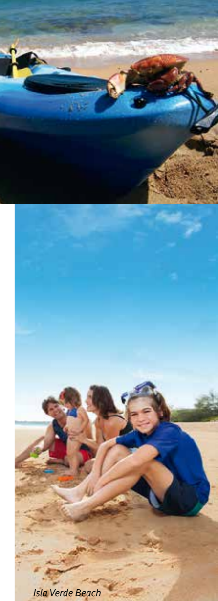
Isla Verde Beach

Die besten Plätze – mit ihren Korallenformationen, riesigen Fassschwämmen und Schwärmen von Riffischen – liegen hier in den flachen Randzonenriffs an der Südküste der Insel, insbesondere Angel Reef, Patti's Reef and Blue Tang Reef.