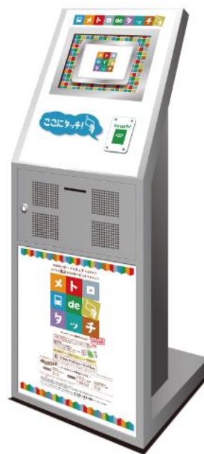
専用端末イメージ