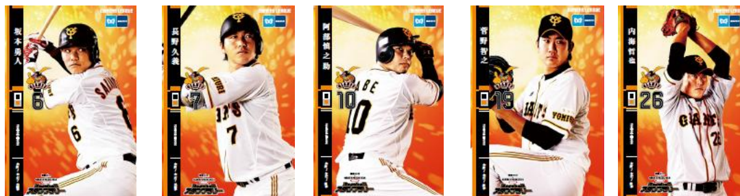
オリジナルのオーナーズリーグカード イメージ