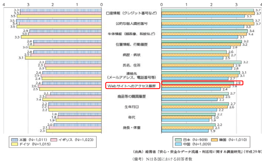
表2 各パーソナルデータに対する不安感

また、6か国共通で提供に強い不安感があるデータは、「口座情報」、「公的な個人識別番号」、「生体情報」、「位置情報、行動履歴」となっている。特に、アジア3か国では、基本情報である「氏名、住所」、「連絡先」及び「生年月日」が欧米3か国に比べて警戒心が強く、我が国では、「Webサイトへのアクセス履歴」の提供に対する不安感が6か国の中で最も高い 11 。