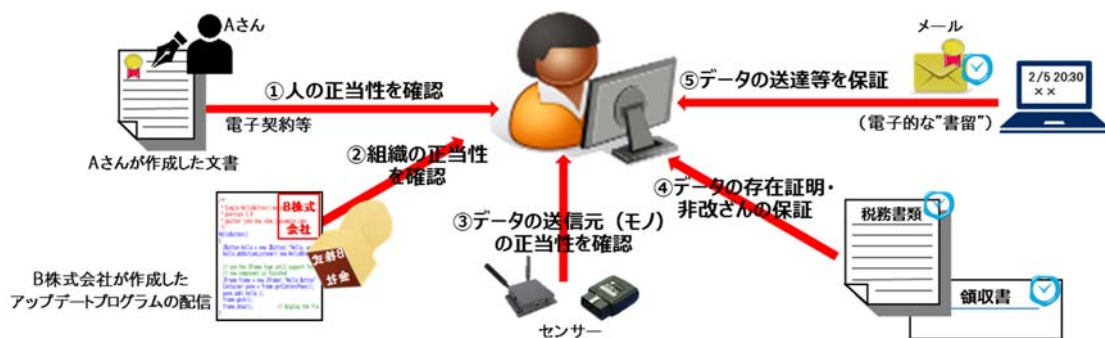
図1 トラストサービスの活用例