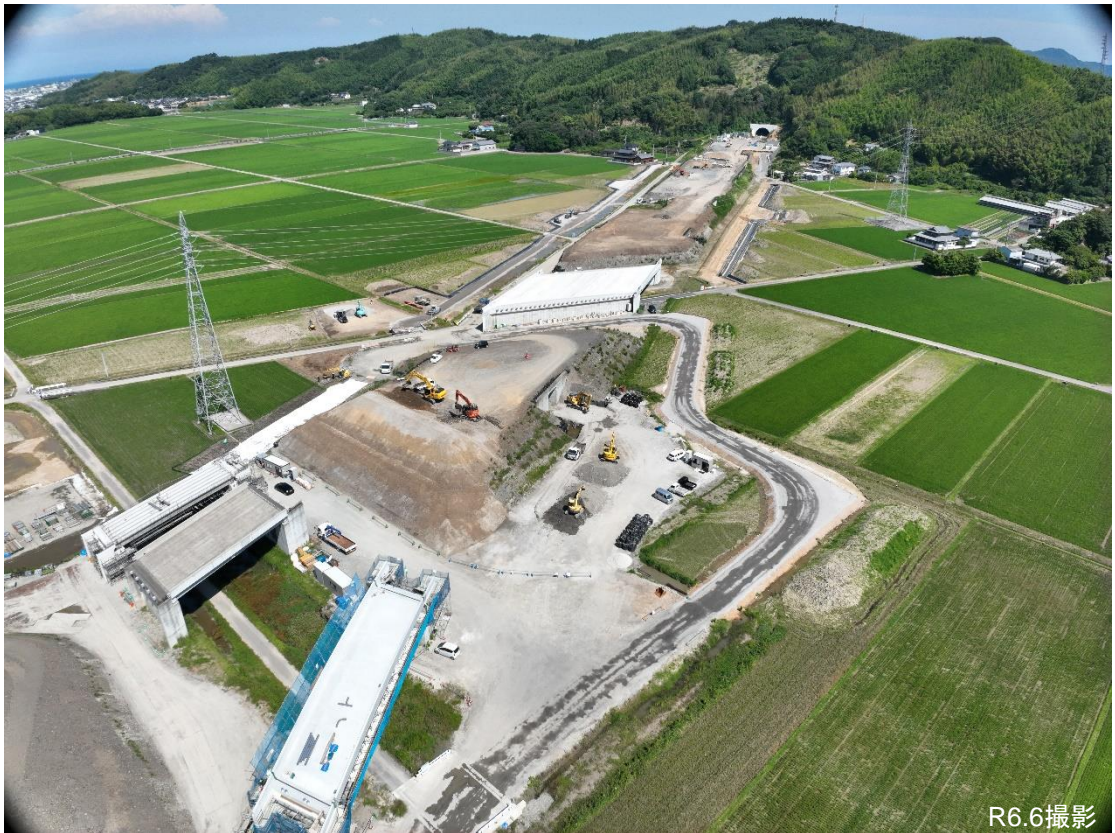
令和7年度の開通を目指し工事を進めている小松島南IC付近