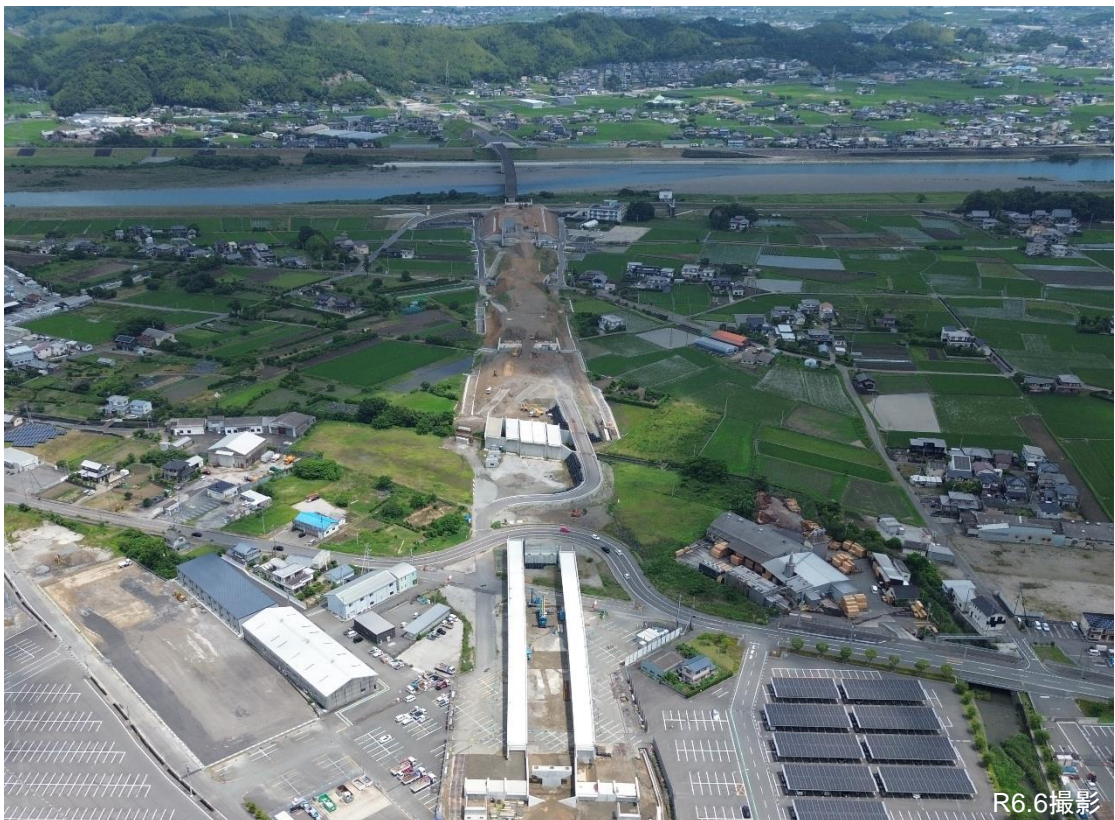
令和7年度の開通を目指し工事を進めている阿南IC付近