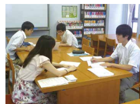
ライティングセンター