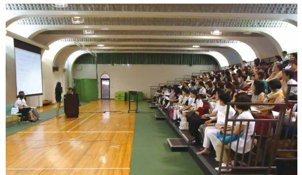
海外大学進学相談会

中学3年生で毎年行われる「東京研修」の行事では、本校の卒業生が所属する企業や組織を訪問して、インタビューや研修をうけ、社会を知り自己への認識と理解を深める機会もあります。