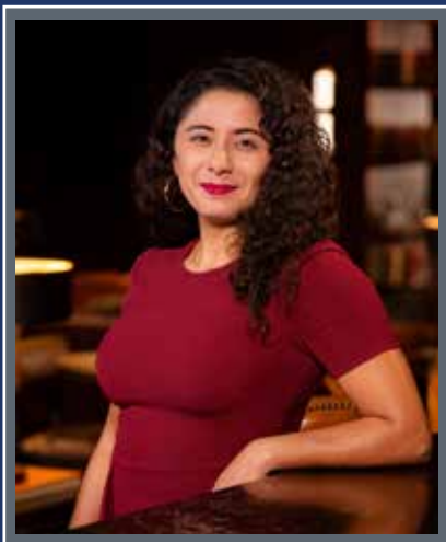
Harris County Judge Lina Hidalgo