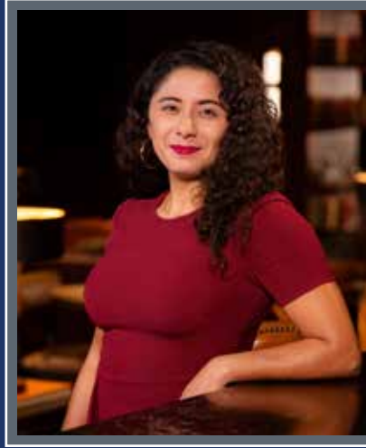
قاضي مقاطعة هاريس، لينا هيدالجو