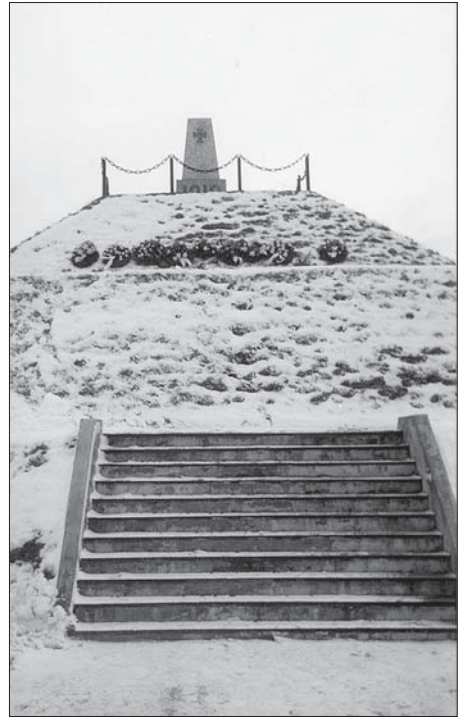
Paju lahingu monument. Foto: Urmas Salo, 2000