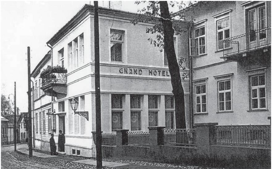
J. Kuperjanovi surmakoht Vallikraavi 10.