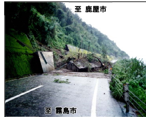
▲国道への土砂流入(H5.8)