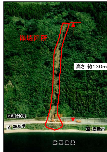
▲災害箇所航空写真(H5.8)