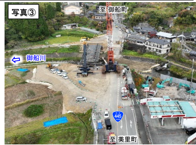
▲ 仮橋上部工を施工中