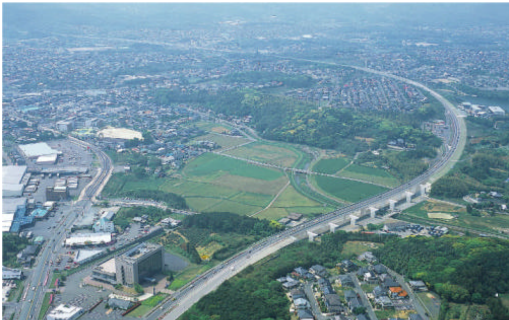
岡垣バイパスイメージ写真(山田峠下団地付近上空より福岡市方面を望む)

3月30日の4車線供用に向けて整備を進めている区間は、 おかがき 岡垣町山田(東交差点付近)から山田ランプ間の約1.3kmの区間です。