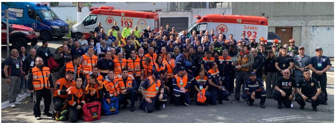
Simulado de Múltiplas Vítimas realizado pelo Hospital Albert Einstein dia 21 de maio.

Telemedicina, Georreferenciamento de Ambulâncias e Macas, Gestão de Frota, Gestão de Pessoas, Gestão de Material Farmacêutico são algumas das soluções que o SAMU-SP irá dispor para uma melhor regulação e gerenciamento de recursos.