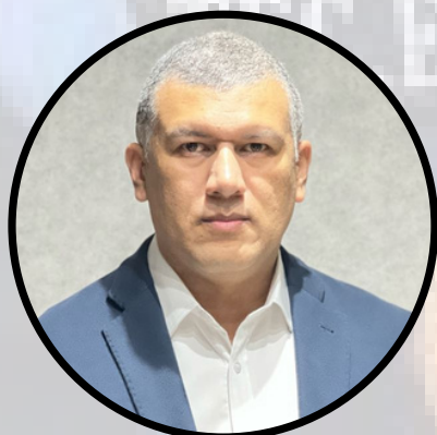
Palavra do Diretor