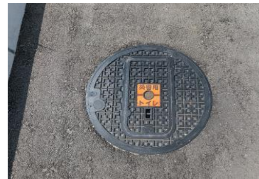
マンホールトイレ