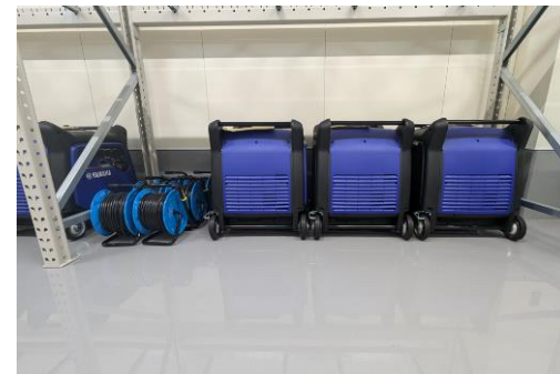
発電機と電工リール