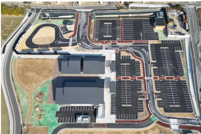
約1万m 2 の駐車場