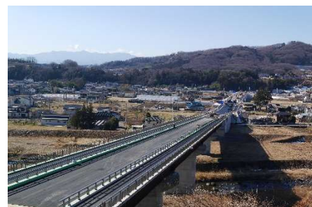
整備中の状況(烏川付近)