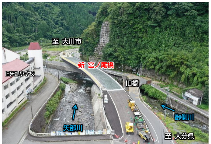
(令和6年7月18日時点の状況)