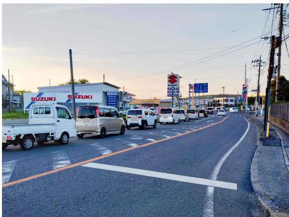
市街地に交通が集中している。