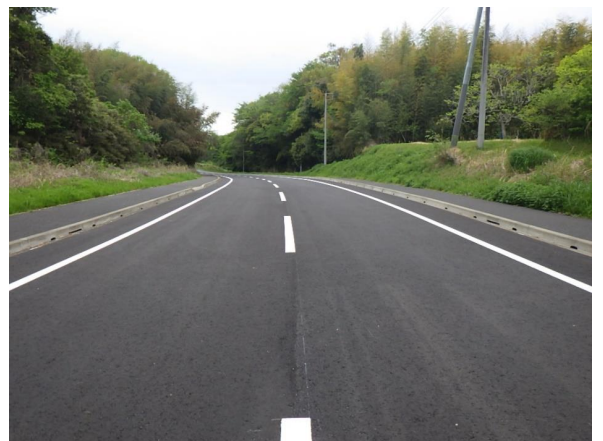
市街地に流入する交通を分散！ 歩道空間を確保！