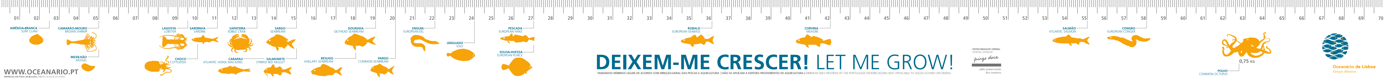
AMÊJOA-BRANCA SURF CLAM