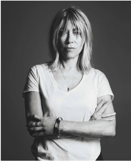
Abb. 8.1.: Eric McNatt, Fotografie von Kim Gordon, 2014.