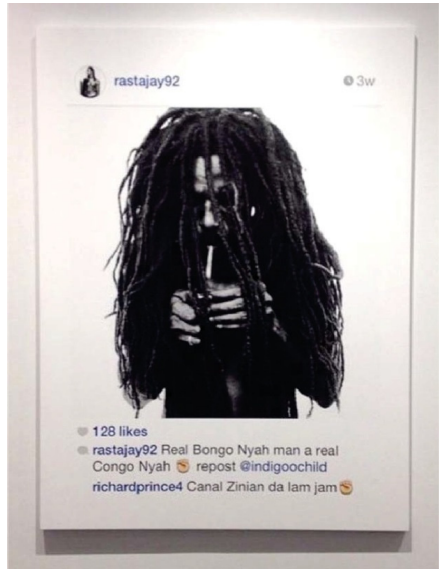
Abb. 5.2.: Richard Prince, Print der „New Portraits“ Reihe, 2014.

setzt. 6 Mit der „New Portraits“ Reihe und mehreren diesbezüglich anhängigen Klagen stellt sich die Frage nach der urheberrechtlichen Zulässigkeit der Appropriation Art neu. Doch nicht nur die Klagen tragen zur erneuten Relevanz dieser Fragestellungen bei, sondern vor allem die veränderte Ausprägung der Appropriation Art: Richard Prince ahmt nun die gängigen Mechanismen der sozialen Netzwerke nach und bringt sie in den Kunstkontext ein. Die Appropriation Art erhebt damit nicht mehr das Kopieren und Transformieren zu einem künstlerischen Prozess, sondern imitiert das alltägliche Kopieren und Transformieren im Internet. Bisher nie dagewesene Möglichkeiten, ein Original ohne Qualitätsverlust mit minimalem Zeitaufwand zu kopieren, haben die Techniken der Appropriation Art demokratisiert und durch die Partizipationskultur im Internet 7 jedermann daran teilhaben lassen. Die Fragen der Collage, des Remix und Sampling in