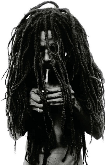
Abb. 5.1.: Donald Graham, „Rastafarian smoking a joint“, 1996.