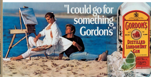
Abb. 4.2.: Jeff Koons, „I could go for something Gordon's“, 1986.