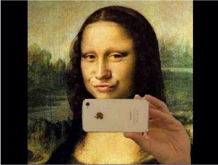
Abb. 11.: Mona Lisa Selfie Montage, o.A.

Dies soll durch eine Auswahl unterschiedlicher Beispiele verdeutlicht werden. Die „Mona Lisa“ (1503–1506) von Leonardo da Vinci – als das bekannteste Gemälde der Welt – wird im Internet häufig abgewandelt und verfremdet. Eine bekannte Montage zeigt sie mit dem typischen Selfie Kussmund („Duckface“) und mit einem Handy in der Hand. 236 Sie wird verschleiert oder in traditioneller Kleidung anderer Kulturen gezeigt, sie bekommt Tattoos, sie wird mit Lego-Steinen oder einer Barbiepuppe nachgebaut, ihr Gesicht wird ersetzt durch Gesichter von Mr. Bean oder Barack Obama. 237 Auch der „Schrei“ (1893) von Edvard Munch wird im Internet für immer neue Montagen genutzt: So gibt es ihn als Kürbis zu sehen, aus Pappe oder Lego und mit Figuren der Serie Simpsons. 238 Die Seite „Classical Art Memes“ 239 zeigt Memes bekannter Kunstwerke, die durch digitale