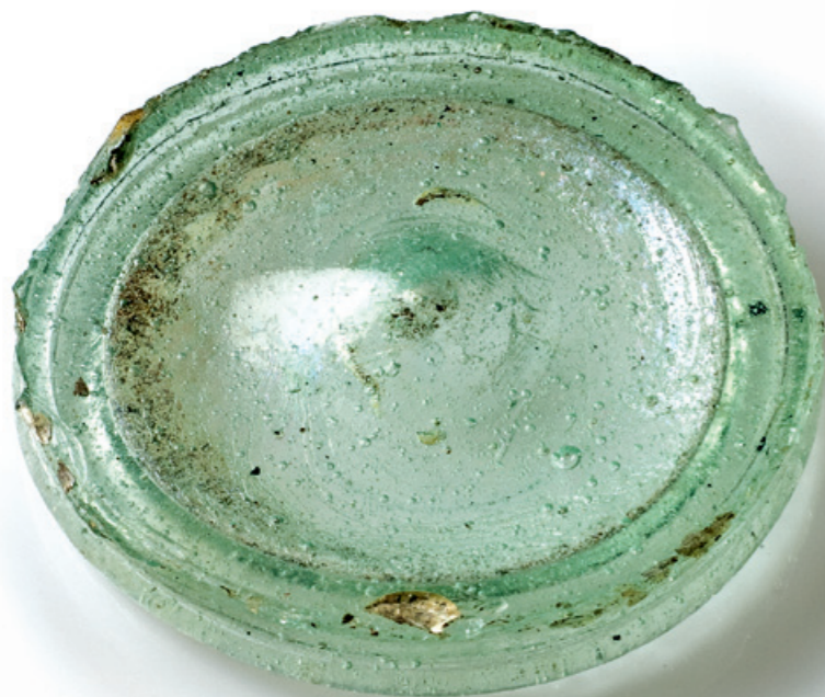
Boden mit Standring eines Glasgefäßes aus Augst. Die Wand des Gefäßes wurde rundherum abgeschlagen, ziemlich exakt entlang dem Verlauf des Standrings. So konnte man den Boden als Deckel benutzen.