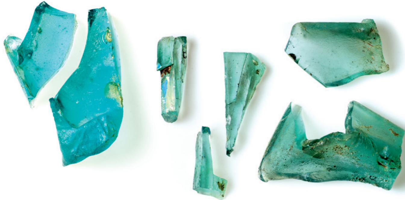
Zersplittertes Altglas, Reste eines ursprünglich vierkantigen Krugs aus Augst.