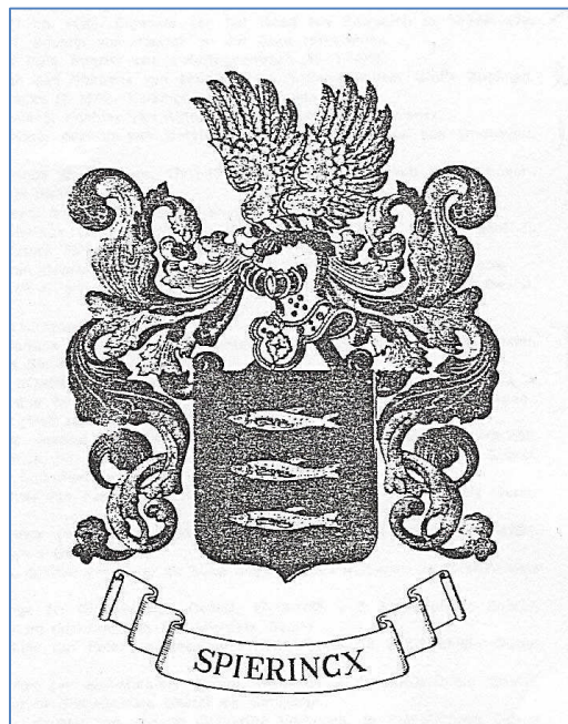
Geregistreerd wapen Spiering (Vlaamse Vereniging voor Familiekunde)

Wapenbeschrijving: In sabel drie boven elkaar geplaatste naar rechts zwemmende spieringen van goud, het schild overtopt met een helm van zilver, getralied, gehalsband en omboord van goud, gevoerd en gehecht van keel, met wrong en dekkleden van sabel en van goud. Helmteken: een vlucht van goud.