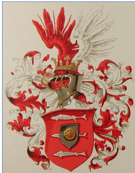
Spiering: Stam en wapenboek Vorsterman van Oyen (Wapenverzameling CBG)