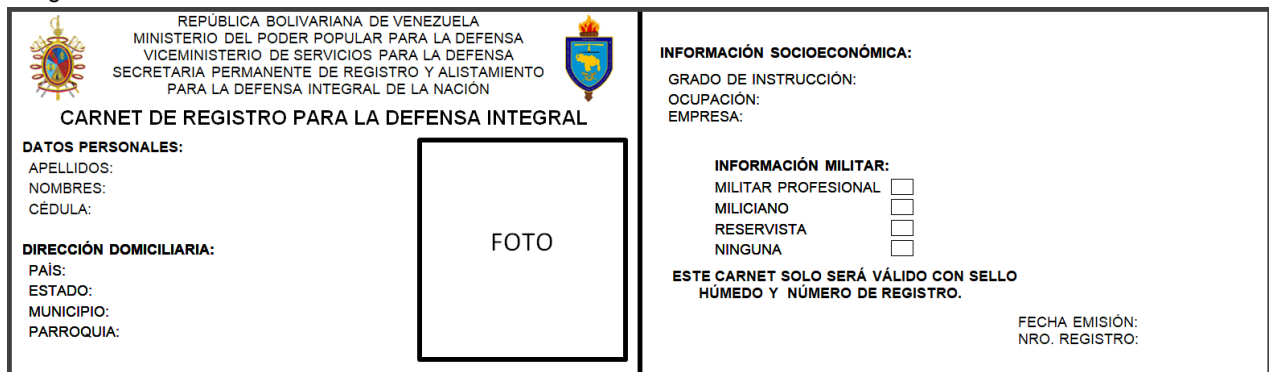
Imagen N° 1: CARNET DE REGISTRO PARA LA DEFENSA INTEGRAL

Una vez certificados los datos, asignado el número de registro y sellado el carnet el ciudadano deberá recortar y plastificar el mismo.