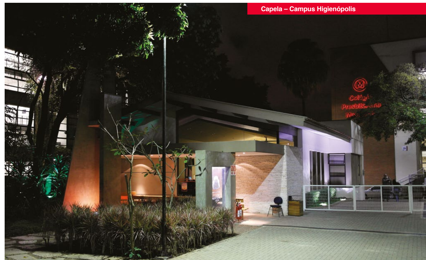
Capela – Campus Higienópolis

Para que cada colaborador tenha clareza sobre seu próprio papel no cumprimento dessa MISSÃO e o foco na VISÃO Institucional do Mackenzie, é essencial elucidar a acepção das expressões que compõem este Código de Ética.