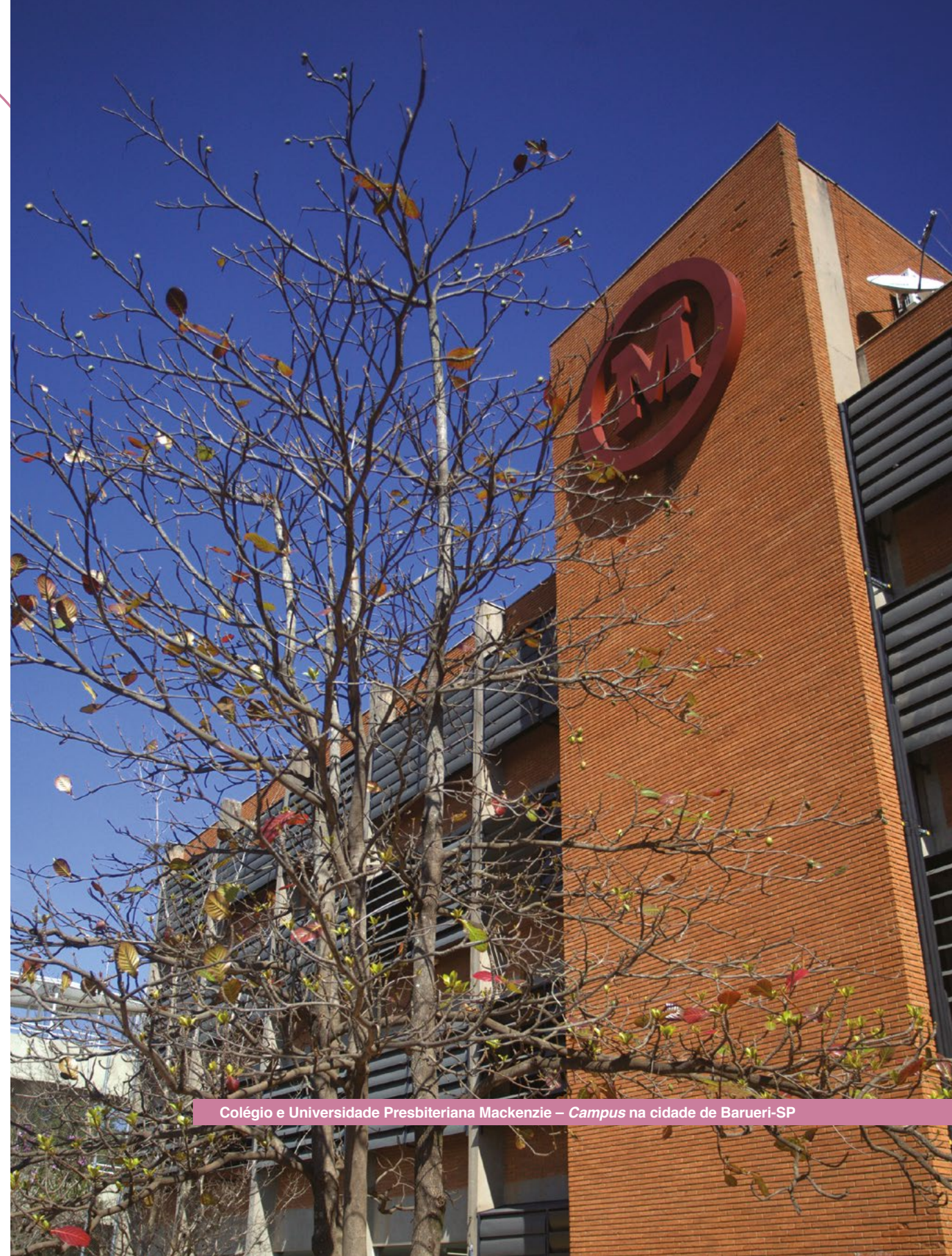
Colégio e Universidade Presbiteriana Mackenzie – Campus na cidade de Barueri-SP

O Regimento Interno do Código de Ética é a política responsável pela condução de situações de infração.