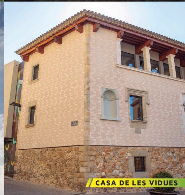
CASA DE LES VIDÜES