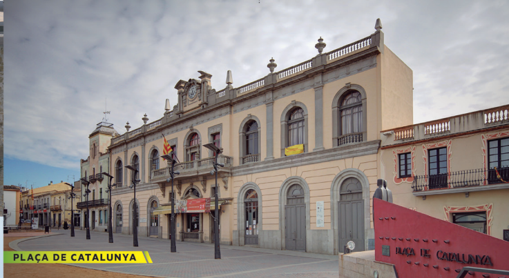
PLAÇA DE CATALUNYA