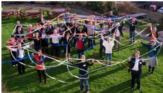
Les partenaires de Rural Alliances au lancement du projet

Après Open Innovation en 2010, Laval Mayenne Technopole a démarré un nouveau projet de coopération européenne du programme Interreg IVB de l'Europe du Nord-Ouest en 2011. Celui-ci se termine en juillet 2015.