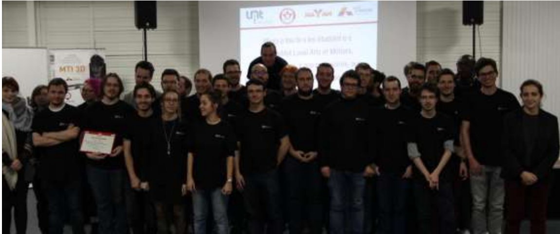
Les étudiant·e·s du Challenge Compétences Mayam 2017

Hier soir avait lieu la 7 ème remise des prix du Challenge Compétences Mayam. Après les délibérations du jury, les meilleurs projets des étudiant·e·s ont été récompensés. Organisée par Laval Mayenne Technopole, l'Institut Laval Arts et Métiers et l'association des Ingénieurs Arts et Métiers de la Mayenne, 4 prix ont été remis.