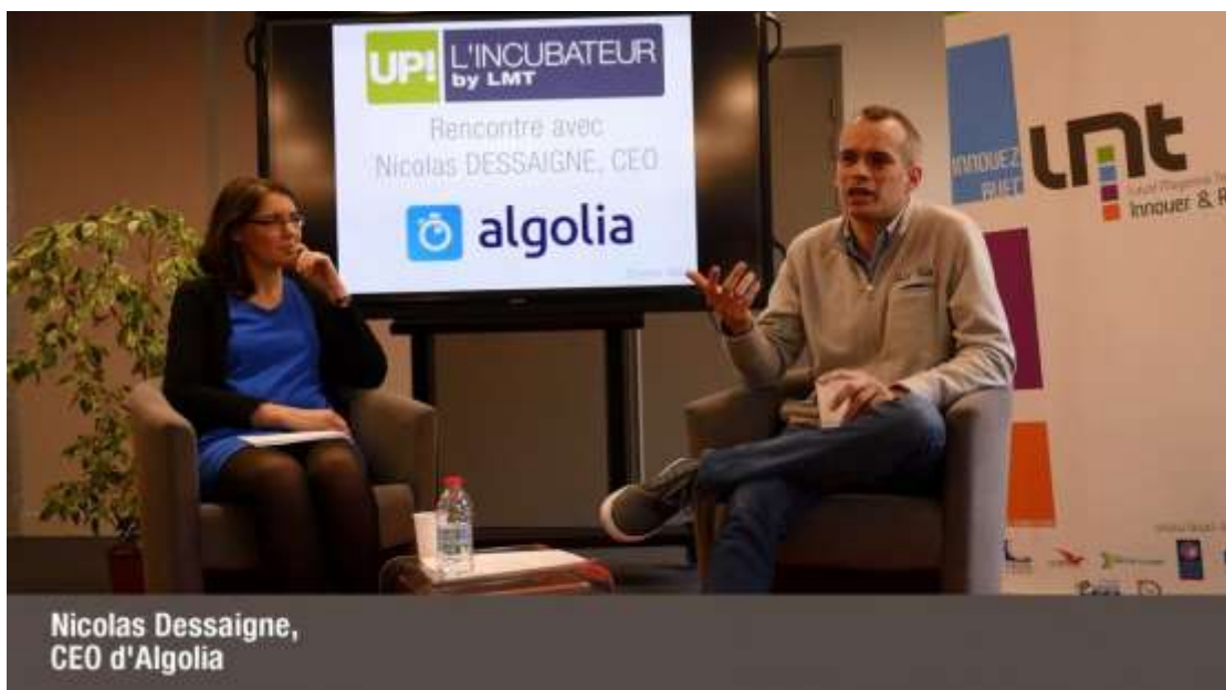
Nicolas Dessaigne, CEO d'Algolia

Vous retrouverez dans cette vidéo un extrait de ses relations avec les investisseurs. C'est un aperçu des coulisses d'une levée de fonds...la suite prochainement !