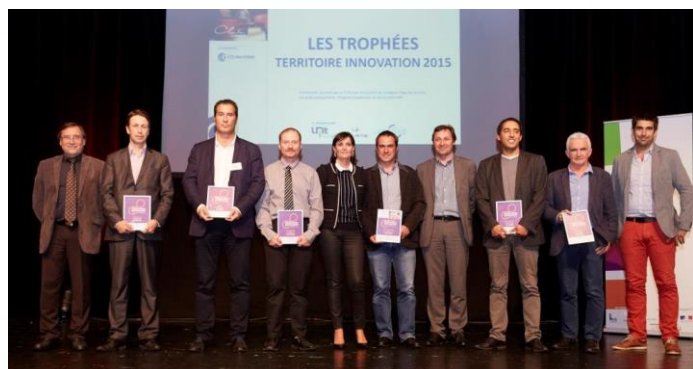
Les lauréats des Trophées Territoire Innovation 2015

Réunissant des partenaires et clients de l'agroalimentaire, Europlastiques a constitué une offre inexistante à ce jour : des repas complets et équilibrés spécifiquement conçus pour les distributeurs automatiques.