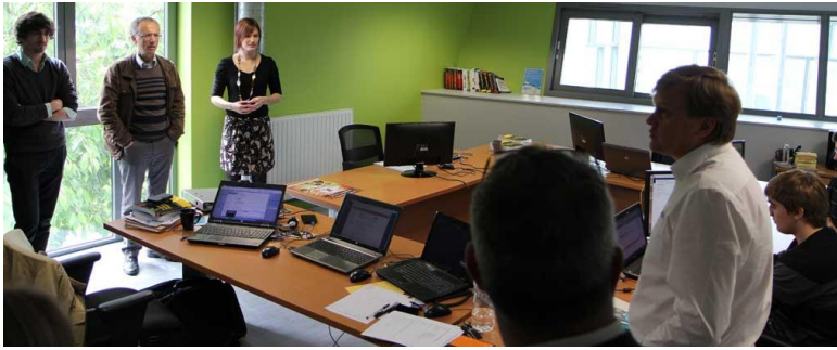
Visite de l'entreprise Kubiksoft, société éditrice de logiciels sur mesure à destination de l'industrie.

Cette inauguration a été l'occasion de découvrir et de visiter les 16 bureaux, les espaces en commun et d'expliquer les services auxquels peuvent prétendre les entreprises.