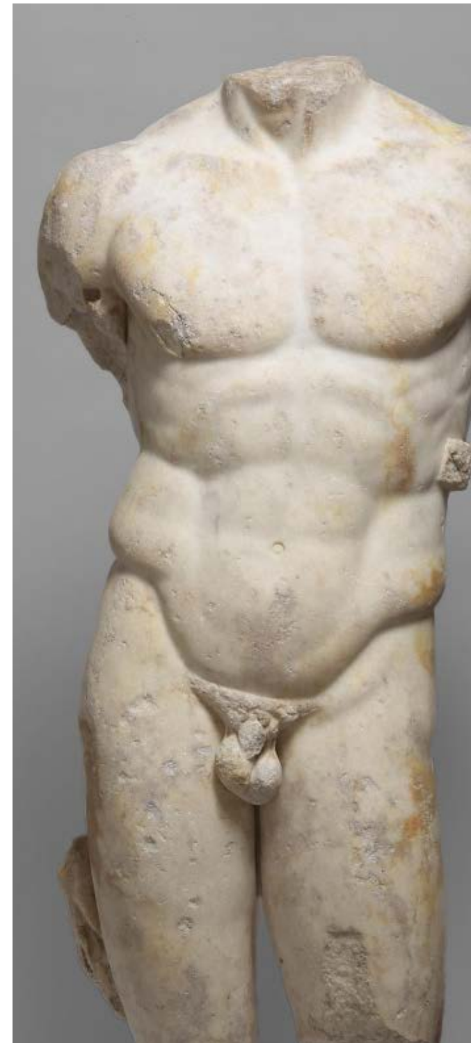
Statue: Torso des Speerträgers (Doryphoros), Römisch, Mittlere Kaiserzeit, 2. Jh. n. Chr., nach griechischem Original des Polyklet um 440 v. Chr.

DO, 29. AUGUST Sammlungen vorgestellt: Das Neue Reich – Schneller, besser, weiter? Ägyptisch-Orientalische Sammlung Melanie Gundacker