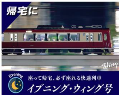
イブニング・ウィング