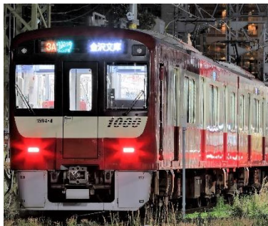
イブニング・ウィング 14号・16号イメージ