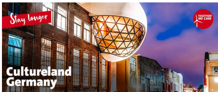
Leipzig Cultureland 2024 2025年キャンペーンモチーフ