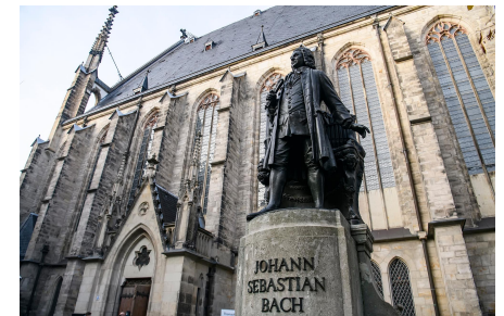
Leipzig_Bach_Stature_shutterstock パッハの町ライプツィヒ トーマス教会とパッハ像

街道は日本人旅行者に親しまれている観光素材の1つであり、日本に対して長年にわたってプロモーションに取り組んでくれている。さらにグローバルキャンペーンを展開していくにあたって、日本が主要ターゲットとして設定されている。また、グリム童話も日本では非常に広く浸透しているため、グリム童話とメルヘン街道に絡めた露出を2025年は増やしていくとともに、異業種とのコラボレーション企画についても検討することができればよいと考えているところだ」