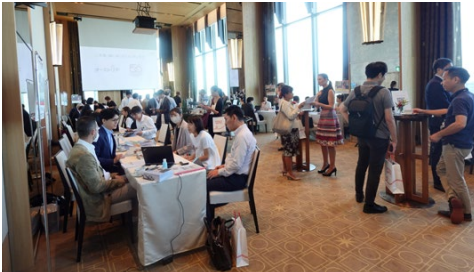
昨年のワークショップの様子

昨年、東京支局開設50周年という節目を迎えたオーストリア大使館観光部（旧オーストリア政府観光局）。半世紀にわたり、オーストリアの多彩な歴史や文化、自然の魅力を日本市場に紹介し、多くの日本人旅行者から支持されるデスティネーションとしての地位を築いてきた。