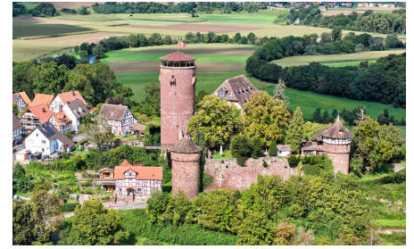
メルヘン街道 トレンデルブルク城 ラプツェルの城と言われる

街道は日本人旅行者に親しまれている観光素材の1つであり、日本に対して長年にわたってプロモーションに取り組んでくれている。さらにグローバルキャンペーンを展開していくにあたって、日本が主要ターゲットとして設定されている。また、グリム童話も日本では非常に広く浸透しているため、グリム童話とメルヘン街道に絡めた露出を2025年は増やしていくとともに、異業種とのコラボレーション企画についても検討することができればよいと考えているところだ」