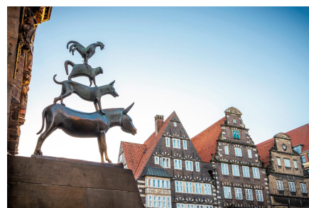
メルヘン街道のハイライト・プレーメン マルクト広場と音楽隊の像

「日本市場において特に力を入れて訴求していきたいと考えているのが『メルヘン街道50周年』というテーマだ。メルヘン