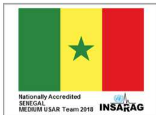
Ilustración 5 Ejemplos de parche