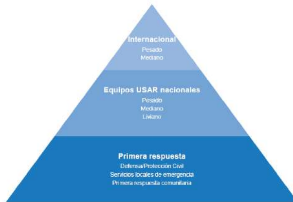
Ilustración 2 Marco de respuesta USAR de INSARAG.

El marco de respuesta USAR de INSARAG nos muestra una estructura que busca asegurar la interoperabilidad entre los diferentes niveles de respuesta USAR, y determina que “es vital que las prácticas de trabajo, el lenguaje técnico y la información sean comunes y compartidos entre todos los niveles del marco de respuesta USAR” (Guías INSARAG, Volumen II, 3.1). Por tanto, los estándares desarrollados para la acreditación de equipos nacionales deben estar alineados con la metodología de INSARAG y por ello, deben ser reconocidos en este mismo marco. Ver Ilustración 2.