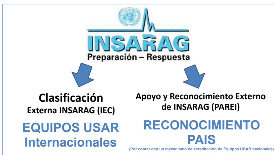
Ilustración 1 Diferencia entre la Clasificación Externa INSARAG (IEC) para equipos USAR Internacionales y el reconocimiento de INSARAG a través del PAREI.

En el 2017, el Grupo Directivo de INSARAG aprobó la propuesta de Apoyo y Reconocimiento Externo INSARAG (PAREI) de los procesos nacionales de acreditación y anima a los Grupo Regionales a ponerlo en práctica y reportar de su implementación en las reuniones anuales del Grupo Directivo.