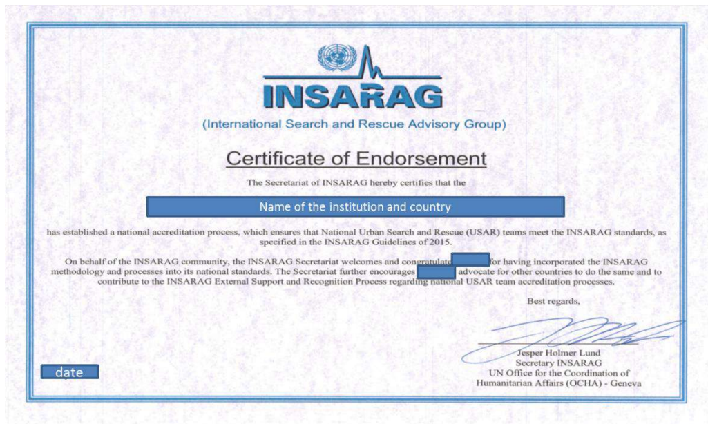
Ilustración 4. Certificado de Reconocimiento