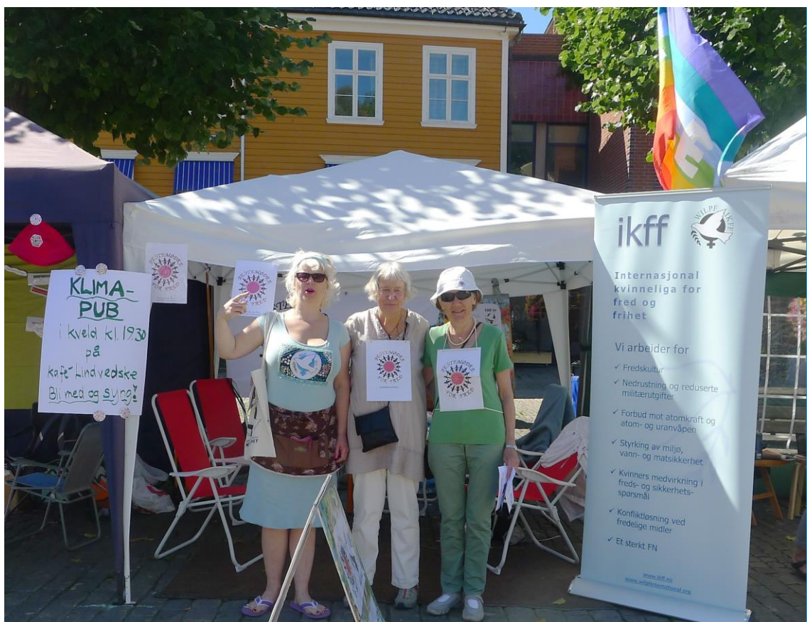
IKFF på stand med Bestemødre for fred i Arendalsuka i 2015.