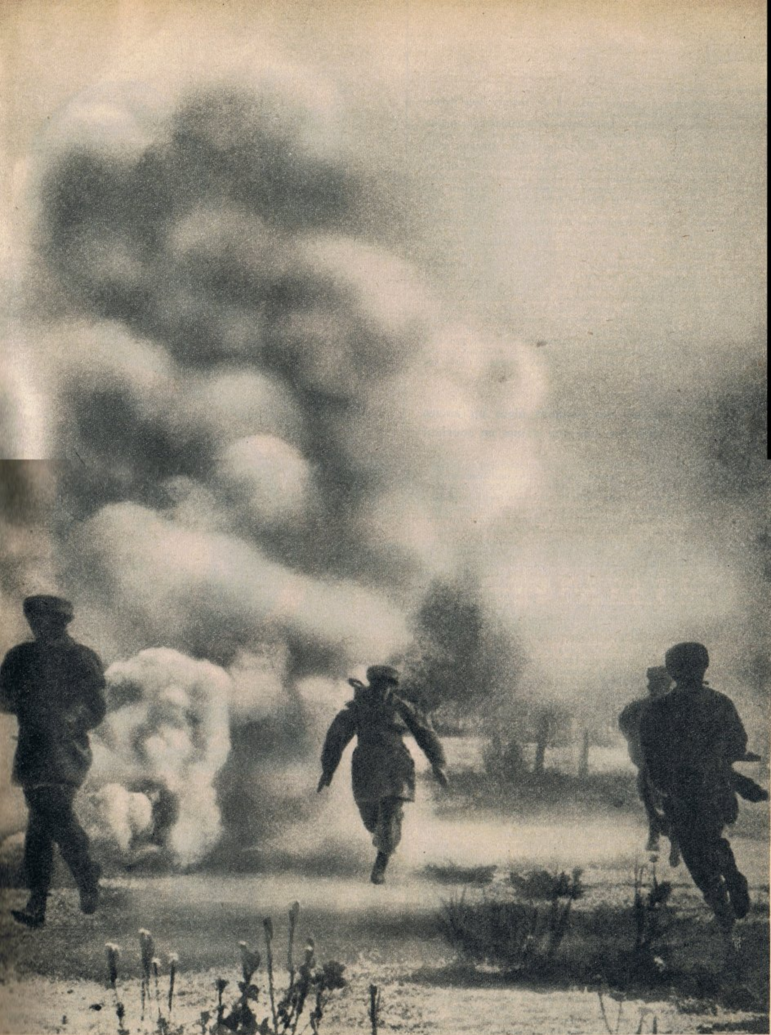
LES PARAS DE FRANCO (CASQUE DE CAOUTCHOUC, TENUE CAMOUFLEE) NE SONT PAS SURPRIS PAR LA GUERRILLA : LE MOT VIENT D'ESPAGNE ET DATE DES GUERRES DE NAPOLEON.