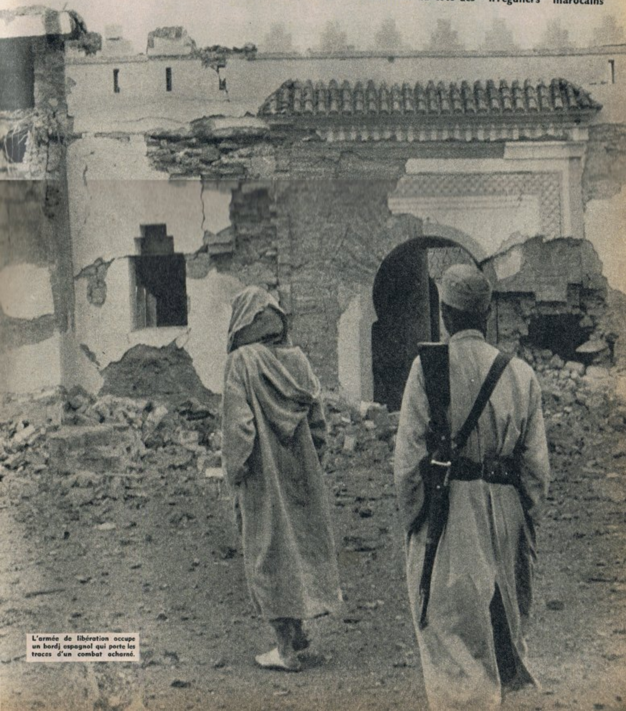
L'armée de libération occupe un bordj espagnol qui porte les traces d'un combat acharné.

De nos envoyés spéciaux Gilbert Graziani du côté des Espagnols, Roger Mauge et Charles Courrière du côté des "irréguliers" marocains