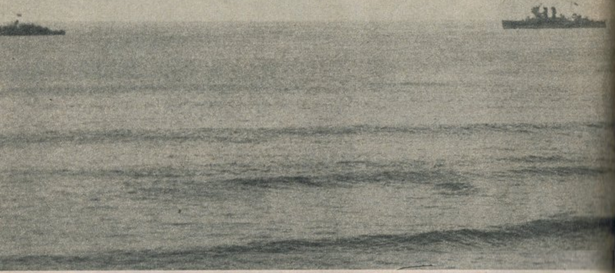
INGOISSANT DANS LES EAUX D'AGADIR : POUR FAIRE ENTENDRE SA PROTESTATION AU GOUVERNEMENT MAROCAIN, FRANCO A ENVOYE UNE ESCADRE DE SIX NAVIRES CROISIERE