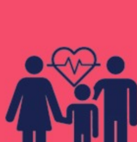
Histórico de doença cardíaca na família