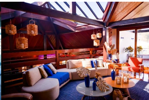
*Lounge 2º andar