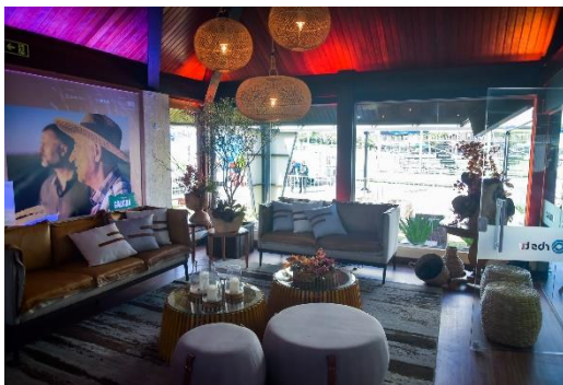
*Lounge 1º andar

Assinatura de marca nos materiais visuais da casa; Possibilidade de ativação da marca*; Ação de sampling.