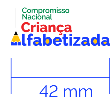
REDUÇÃO MÁXIMA Mídia Impressa