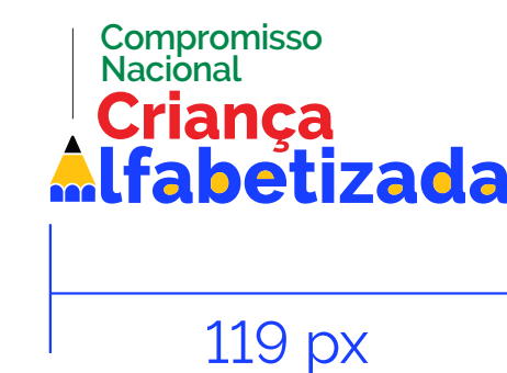
REDUÇÃO MÁXIMA Mídia Eletrônica