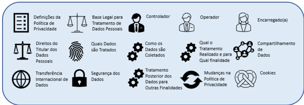
Figura 2. Tópicos da Política de Privacidade

A Política de Privacidade cumpre, fundamentalmente, o dever de transparência disposto como princípio na LGPD, tendo como objetivo descrever ao titular dos dados pessoais, os procedimentos e processos adotados no tratamento de dados pessoais realizado pelo serviço, bem como informá-lo sobre as medidas de proteção de dados pessoais adotadas.