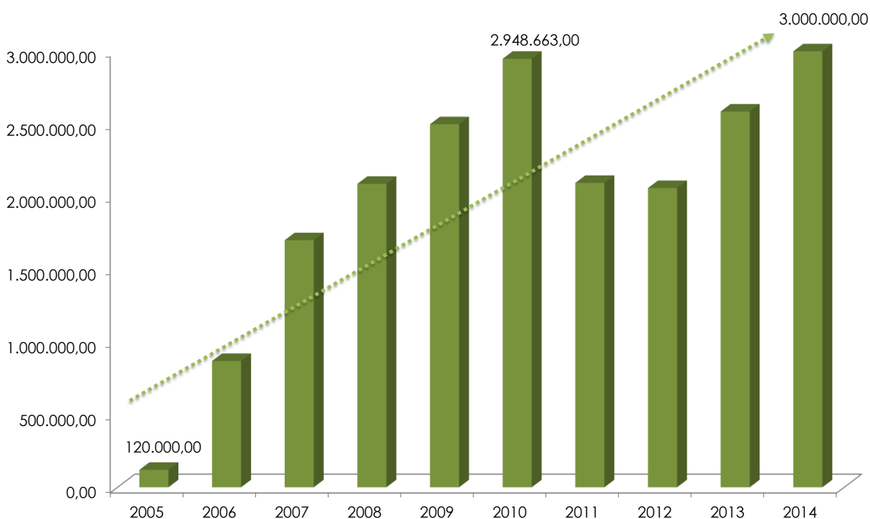
Gráfico 4 – Evolução dos Recursos de Fomento (R$) Disponibilizados ao Prêmio Adicional de Renda (PAR) de 2005 a 2014

(*) Valores nominais.