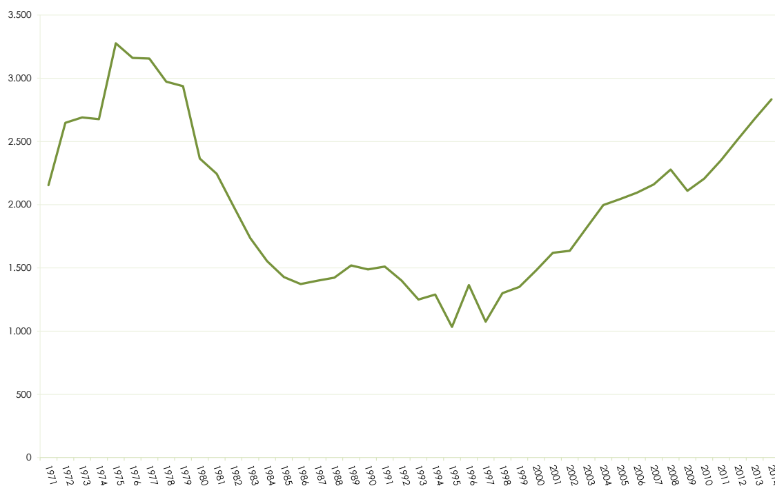
Gráfico 1 - Evolução do Número de Salas no Brasil – 1971 a 2014