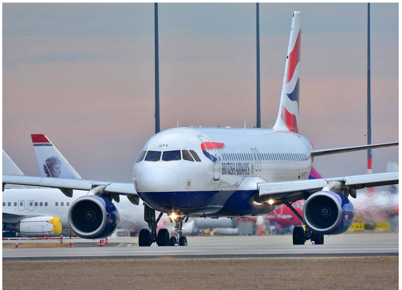
Avió apropant-se a la terminal.

La raó de la caiguda va ser l'actualització de l'antivirus creat per la plataforma de ciberseguretat CrowdStrike, proveïdor de Microsoft, que no es va adaptar bé als sistemes Windows i va afectar també el núvol. Es va originar el dijous a la nit als Estats Units i a poc a poc es va anar expandint fins a afectar països a pràcticament tot el món. Els