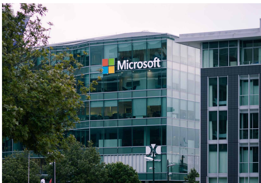
Una de les seus de Microsoft.

més afectats, però, degut també al fet que estem en ple estiu, van ser els aeroports i els espanyols no han sigut els únics, el problema va afectar els aeroports de la Índia, Austràlia, Hong Kong, Alemanya, Estats Units o Suïssa, entre d'altres.