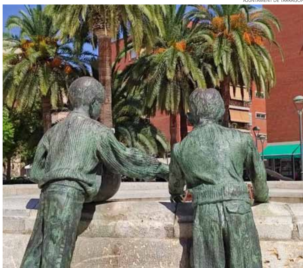
Font de la plaça dels infants.

El consell plenari de l'Ajuntament de Tarragona ha aprovat el Pla d'emergència en situació de sequera de la ciutat. Es tracta del document que recull, a l'àmbit municipal, la planificació i gestió de l'aigua del municipi en els escenaris en què l'Agència Catalana de l'Aigua (ACA) declari la situació de sequera – pre-alerta, alerta, excepcionalitat i emergència –, per tal de poder establir un model d'actuació i de comportament dels serveis municipals, el qual garanteixi tant la coordinació dels recursos necessaris, com l'actuació a fi de minimitzar els efectes posteriors de les situacions de sequera