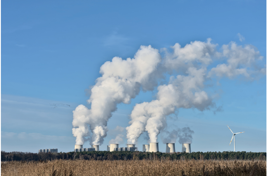
Abb. 5: Strukturwandel im Lausitzer Revier (Kraftwerk Jämschwalde)