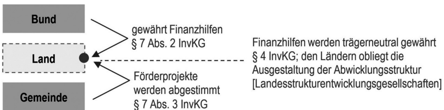
Abb. 1: Abwicklungsstruktur des InvKG zwischen Bund, Ländern und Gemeinden / Quelle: Eigene Darstellung

Der energiepolitisch initiierte Strukturwandel in Deutschland ist eine gesamtgesellschaftliche Aufgabe, die sich in allen sozialen, wirtschaftlichen und ökologischen Themenbereichen niederschlägt und trotz konkreter Ausstiegsdaten eine Jahrhundertaufgabe darstellt (WSB 2019: 104). Der Strukturwandel fokussiert sich in der Bundesrepublik maßgeblich auf drei Braunkohlereviere: das Rheinische, das Mitteldeutsche und das Lausitzer Revier, auch wenn der damit einhergehende Transformationsprozess weit über die räumlichen Reviergrenzen hinaus wirksam wird. Diese räumliche Aufgliederung ist in mehrfacher Hinsicht relevant und interessant zugleich, da die drei Reviere aus grundlegend unterschiedlichen Ausgangssituationen in den Strukturwandel eingetreten sind und auch entsprechend verschiedenartige Herangehensweisen und Akteursstrukturen gewählt haben (Gailing 2015: 7). Diesen „Interpretationsspielraum“ eröffnet das Investitionsgesetz Kohleregionen (InvKG) 1 , indem es zwar drei Akteursgruppen adressiert, die im politischen Sinne in die Verantwortung genommen werden (Bund, Länder und Gemeinden bzw. Gemeindeverbände), zugleich aber keine Vorgaben zur Ausgestaltung der Beziehungen und Verfahren trifft.