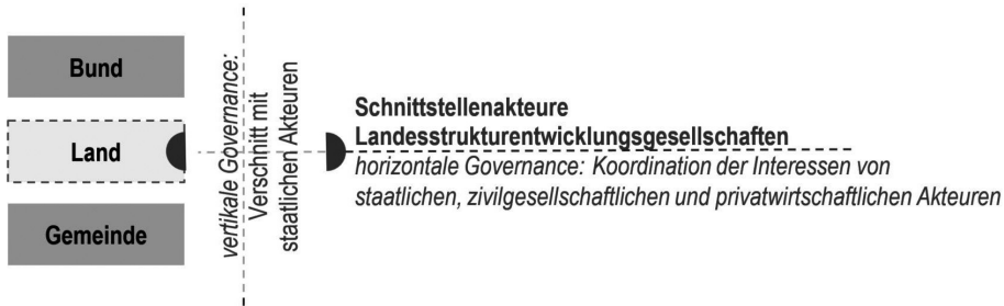
Abb. 2: Landesstrukturentwicklungsgesellschaften als Schnittstellenakteure in der vertikalen und horizontalen Governance

scheidungsfindungsprozessen verwoben sind, zum anderen sind sie vertikal in die Governance-Struktur des Kohleausstiegs zwischen Bund, Ländern und Kommunen eingebunden. Entsprechend den individuellen Ausgangslagen in den Revieren sind auch die akteursbezogenen Herangehensweisen und damit die Strukturentwicklungsgesellschaften unterschiedlich aufgestellt.