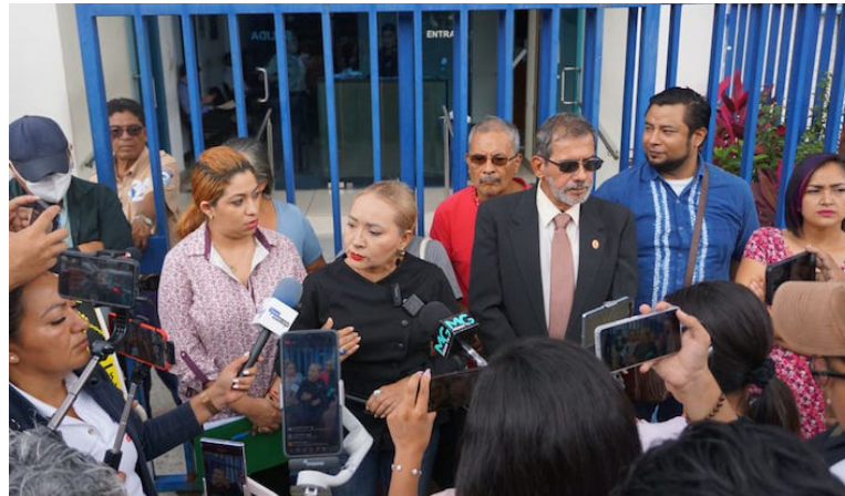
Diferentes organizaciones sociales presentaron en la Fiscalía General de la República (FGR) un aviso penal sobre las capturas “arbitrarias” de líderes de la Alianza Nacional El Salvador en Paz.

Cruz manifestó que en las primeras horas de las capturas se dieron en “calidad de desaparecidos”. Posteriormente, lo calificó como “tortura”, debido a que los primeros días se obstaculizó la entrega de medicamentos y tratamientos necesarios para las enfermedades crónicas que padecen varios de los detenidos.