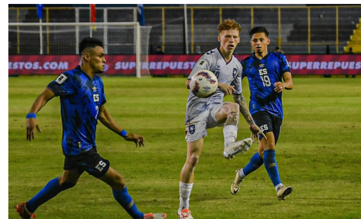
El Salvador empató 0-0 con Puerto Rico, en el Cuscatlán, en el inicio de las eliminatorias rumbo a la Copa del Mundo 2026.

En el caso particular del grupo F, donde se ubica El Salvador, tras los primeros partidos, finalizó con Surinam a la cabeza, al obtener seis de seis puntos con dos victorias; Puerto Rico, con una victoria y un empate con cuatro unidades, en la segunda, El Salvador con los mismos puntos, pero por diferencia de goles en la tercera, y