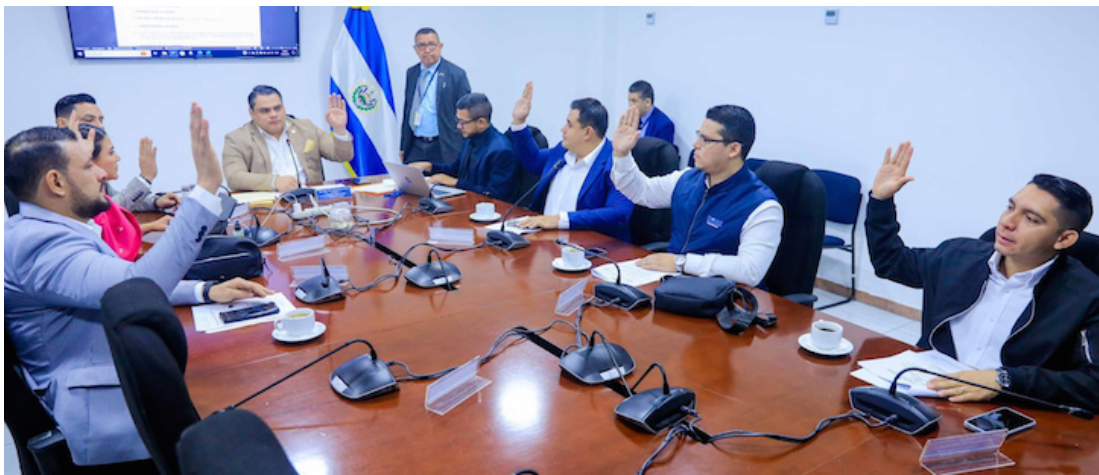
Los diputados de la Comisión de Seguridad acuerdan invitar, en las próximas sesiones, a representantes del Gabinete de Seguridad y FGR a fin de que brinden su opinión técnica sobre la iniciativa en estudio.