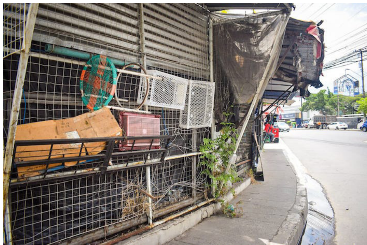
Algunos comerciantes comienzan a retirar sus pertenencias de las cercanías del centro comercial Plaza Mundo.

que “reubicará a los vendedores de la zona de la Plaza Mundo a un lugar seguro y viable, donde también contarán con un capital semilla para seguir con sus actividades”. Sin embargo, algunos vendedores manifestaron que no han sido notificados de reubicación ni de compensación económica, solo de desalojo.