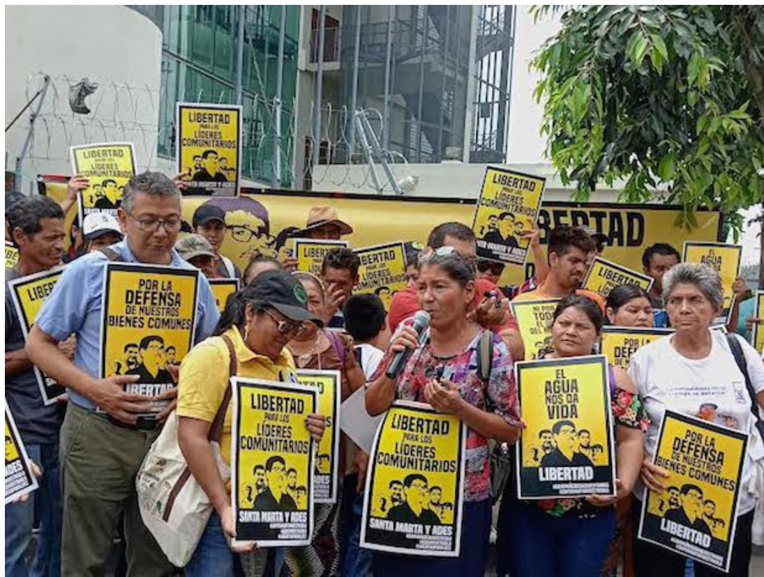
La Comunidad Santa Marta y ADES, denuncian que han pasado 17 meses de criminalización y persecución judicial contra sus defensores ambientales, en donde el Estado los priva de libertad y seguir cuidando el agua.

Denunciaron, además, la falta de cumplimiento de la resolución del Juzgado de Instrucción, que otorgó el arresto domiciliario y la atención médica, pero la Policía Nacional Civil, en varias ocasiones, no ha llegado