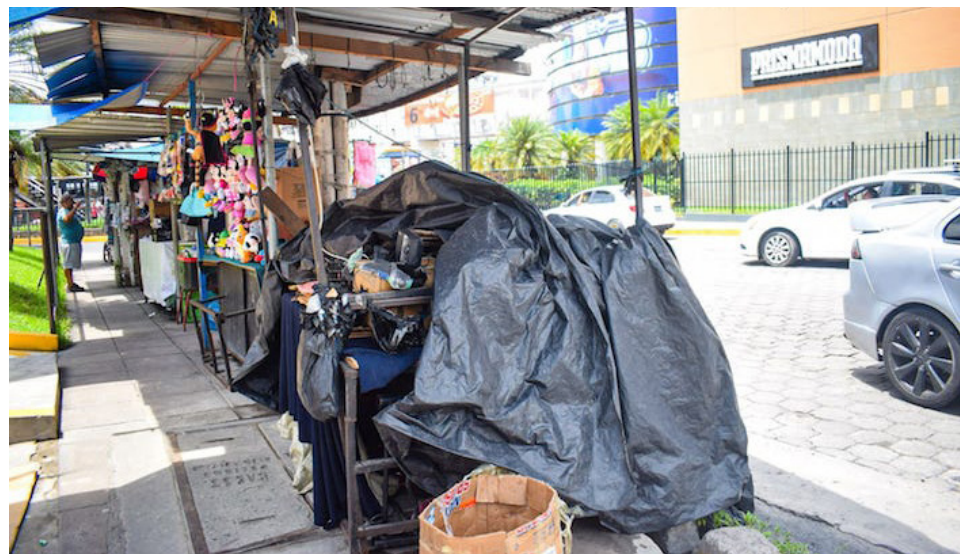
Comerciantes informales señalan que la alcaldía solo les ha “prometido” una reubicación. Sin embargo, a pocas horas del desalojo, no saben dónde serán ubicados.

La alcaldía, a través de un comunicado el día 11 de junio, dijo