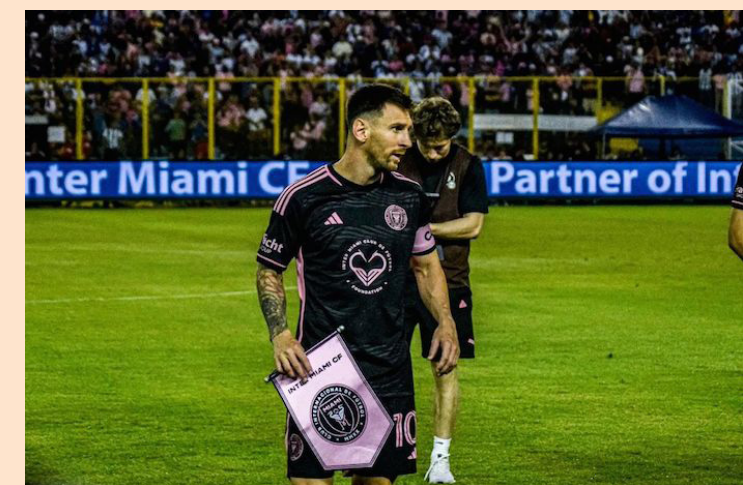
Messi en el estadio Cuscatlán para el amistoso del Inter de Miami contra la Selección en enero de 2024.

Grupo F: Surinam, Puerto Rico, El Salvador, San Vicente y Granadinas, Anguila