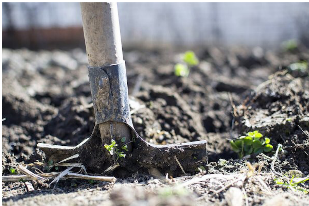
La Asociación Cámara Salvadoreña de Pequeños y Medianos Productores Agropecuarios (CAMPO), demandan del Minsiterio de Agricultura y Ganadería (MAG), impulsar la “reactivación del agro”, para mejorar las condiciones de las familias rurales.

profundización de la crisis alimentaria y las posibilidades de una hambruna nacional. En tal sentido, y considerando la gravedad que cada vez más están tomando los fenómenos naturales, nos permitimos hacer una invitación especial para la formación de una Comisión Técnica Conjunta”, manifestó Campo.