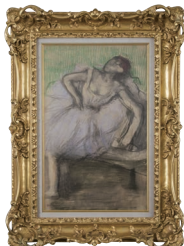
エドガー・ドガ「踊り子」(1901年) Edgar Degas DANSEUSE ASSISE, JUPE MAUVE