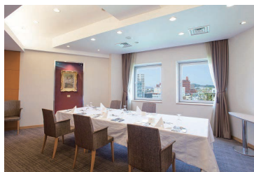
特別ラウンジでは「エドガー・ドガ」の作品を常設展示 Permanent exhibition of works by Edgar Degas in the special lounge