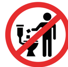
Figura 4 2