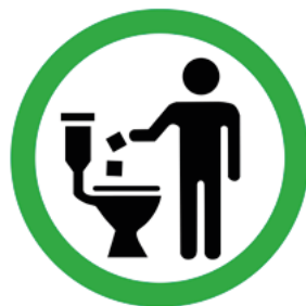
Figura 2 2