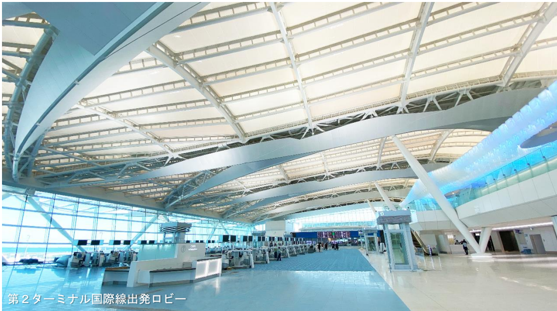
第 2 ターミナル国際線出発ロビー