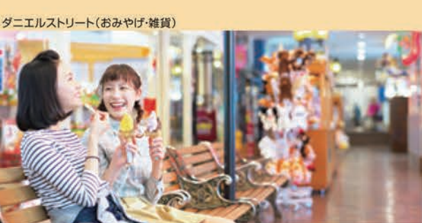
ダニエルストリート(おみやげ・雑貨)