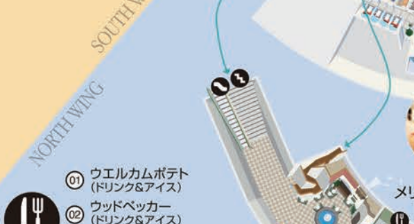
2階建てメリーゴーランド「カルーセル」