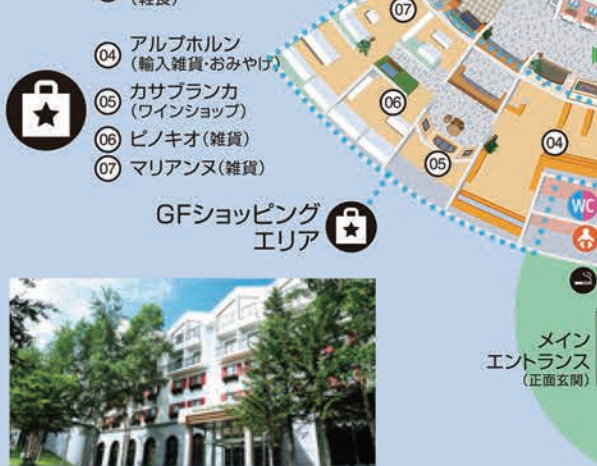
メインエントランス(正面玄関)