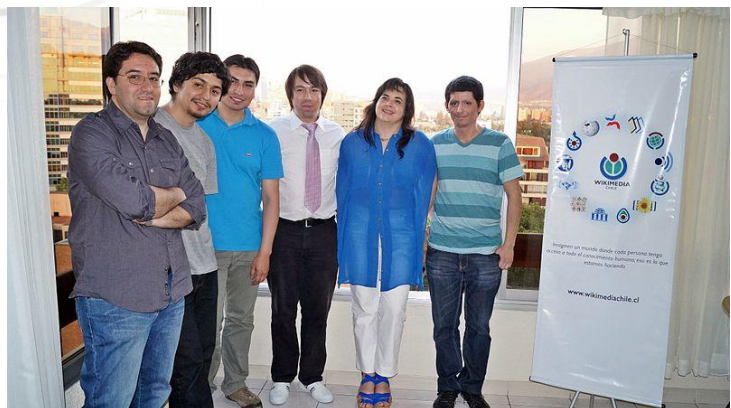
Directorio de Wikimedia Chile, periodo 2012-2014.

Estos son nuestros deseos para este año 2013, y que esperamos nos permitan continuar de la mejor manera hasta el 2014, estimulando a todos los socios a concluir de la mejor manera este período.