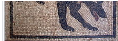
Mosaic romà mostrant un gos amb collar

Juei mite FISTOCÉ-PROIOLCE , fa entre 17.000 i 19.000 anys. Les poblacions de gossos i llops antigues i moderns són el producte d'una única domesticació, i els gossos mestics podrien haver-se aparellat amb llops (la genètica es coneix com a introgressió ). Els gossos en tenir l'origen en la cria de cadells de llop podrien de reproduir-se entre ells, haurien donat lloc a descendents de llops menys propensos a fugir dels humans; aquesta tendència va portar a un estat de domesticació completa. [17]