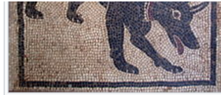
Mosaic romà mostrant un gos amb collar

ic superior , a prop del límit Plistocè-Holocè , fa entre 17.000 i nèniques de les poblacions de gossos i llops antigues i ia si tots els gossos són el producte d'una única domesticació, loc. Els gossos domèstics podrien haver-se aparellat amb procés que en genètica es coneix com a introgressió ). Els processos; podrien tenir l'origen en la cria de cadells de llop unes generacions de reproduir-se entre ells, haurien donat ien ser els descendents de llops menys propensos a fugir dels humans; aquesta tendència cions fins a arribar a un estat de domesticació completa. [17]