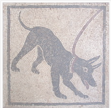
Mosaic romà mostrant un gos amb collar